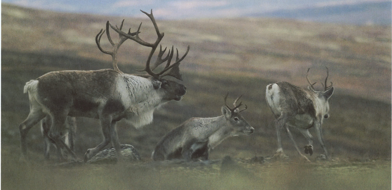
Voksen bukk og simle under brunsten i Snøhetta høsten 2006.

Det ble i 2006 gjennomført tellinger i samtlige overvåkingsområder. Foruten de faste områdene Forollhogna, Knutshø, Snøhetta, Rondane, Hardangervidda, Setesdal Ryfylkeheiene og Reindalen/Svalbard bidro NINA til gjennomføring av kalvetellingene i Ottadalen nordområdet og Setesdal Austhei.