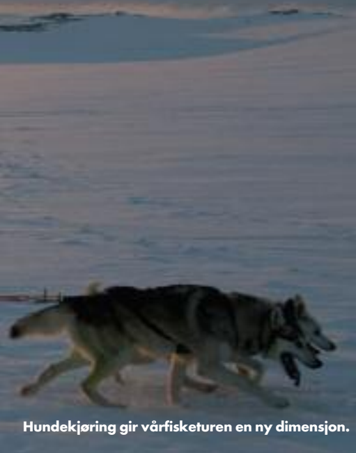
Hundekjøring gir vårfisketuren en ny dimensjon.

veit at det ikke alltid bare er å gå ut og hente seg stor fisk. En edrullig markedsføring er derfor viktig. Opplevelsene bør alltid stå ift forventningene. Ifjordfjellet har imidlertid både gode fiskebestander og mye villmark, et godt utgangspunkt for tilrettelegging og salg av fisketuristprodukter. På innlandsfiske er det nesten bare norske kunder, og godt fiske er viktig for deres valg. Erfaringene Nordlys Opplevelser har etter 4 år med salg av fjellfiske er gode.