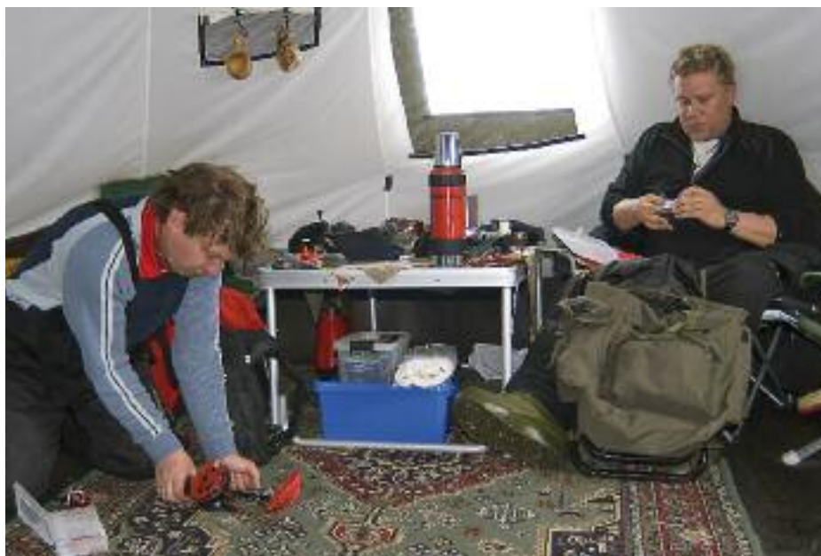
Kundene kan leie velutstyrte gammetelt som har alt utenom personlig utstyr.

Nordlys Opplevelser har lært mye siden oppstarten for snart 4 år siden. De begynner også