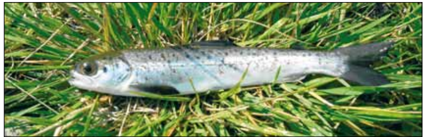
Laksesmolt trenger betydelig lengre tid på å bli "frisk" enn det vi tidligere antok. Bildet viser villsmolt tatt på utvandring fra elv.

I eksponeringsforsøket vårt ble fisk eksponert for moderat surt vann (pH 5,7 og 10 µg LAI/l) og dermed "skadet". Fisk i det sure vannet akkumulerte Al på gjellene, fikk redusert ione-balanse og forhøyd glukose, mens gjelleenzym forble upåvirket (se tabellen over). Når denne fisken ble overført fra surt til godt vann (pH 6,8 og 3 µg LAI/l) ble fiskens