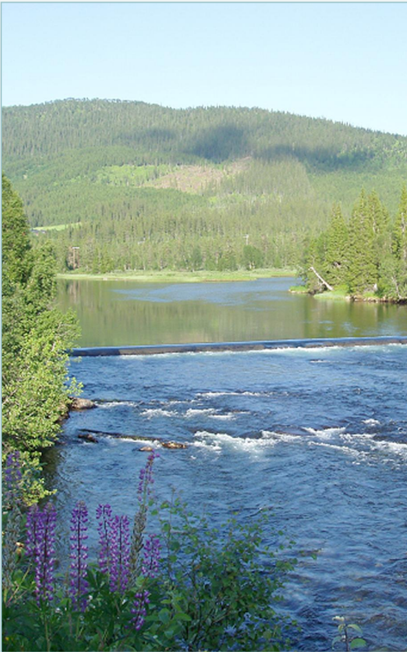
Småblank er en ferskvannsstasjonær laksebestand som finnes bare i Namsenvassdraget.

ikke vende tilbake til elva ovenfor fossen. Det ser imidlertid ut til at hunner som kjønnsmodnes i ferskvann oppstår oftere når sommertemperaturen i vannet er gjennomgående lav og veksten hos yngelen dårlig. Slike vanntemperaturer var det trolig i Namsen like etter siste istid, og temperaturforholdene kan ha vært gunstige for dannelsen av kjønnsmodne hunner. De kjønnsmodne hunnene var i stand til å overleve og formere seg ovenfor de nydannede fossene i Namsen, og ble dermed opphav til småblanken. Den ble trolig isolert fra vanlig, sjøvandrende laks for 9 500 år siden.