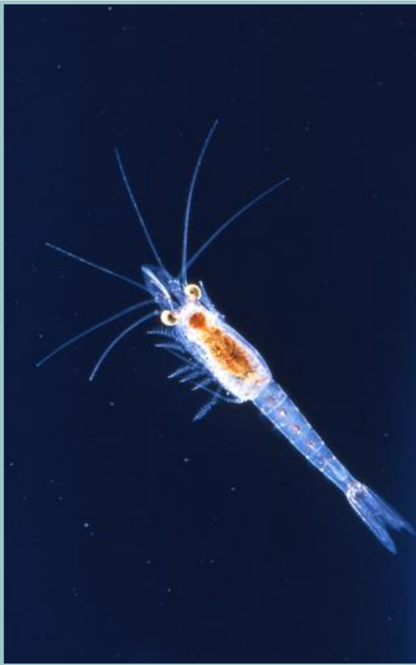
Pungreka sett ovenfra.

konkurrerer med røya om føden. Den er dessuten en mer effektiv predator på dyreplankton, og sammenlignet med røya er den i stand til å spise dyreplankton med mindre kroppsstørrelse. I de fleste dype innsjøer hvor mysis er satt ut fant forskerne, gjerne etter 10 år eller mer, at bestanden av vannlopper i de fri vannmasser var redusert til et minimum, og til dels erstattet av arter som er langt mindre attraktive for fisken. Resultatet av utsettingene ble derfor at næringsgrunnlaget for noen fiskearter ble sterkt redusert.