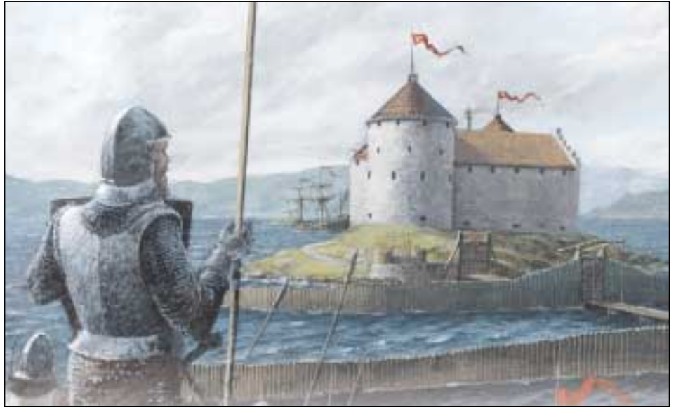
Rekonstruksjon av Steinvikholm slott. Tegning (utsnitt): GUNNAR FLUSUM (faglig konsulent SÆBJØRG W. NORDEIDE)

Opptil 250 soldater skal ha hatt tilhold ved slottet i 1536-37, men det er usikkert hvor mange av disse som bodde på slottet. Noen sov kanskje på båtene de var mannskap på. Det er nevnt 42 senger blant inventaret fra 1537, og en normal besetning lå vel nærmere dette tallet.