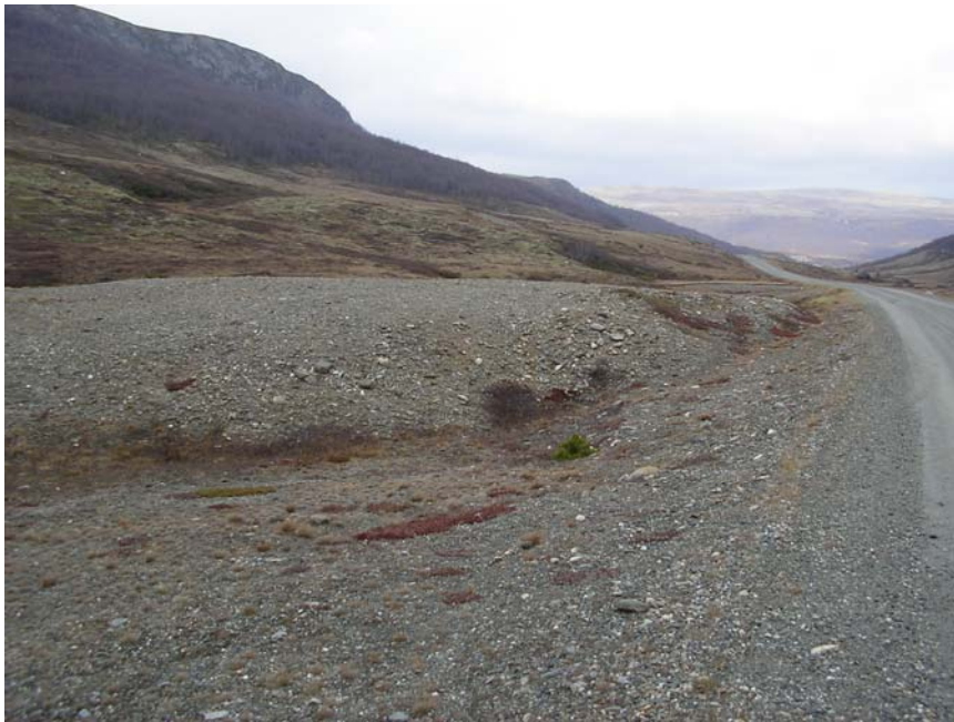
Vegen går gjennom et landskapsvernområde, med fjellvegetasjon på begge sider.