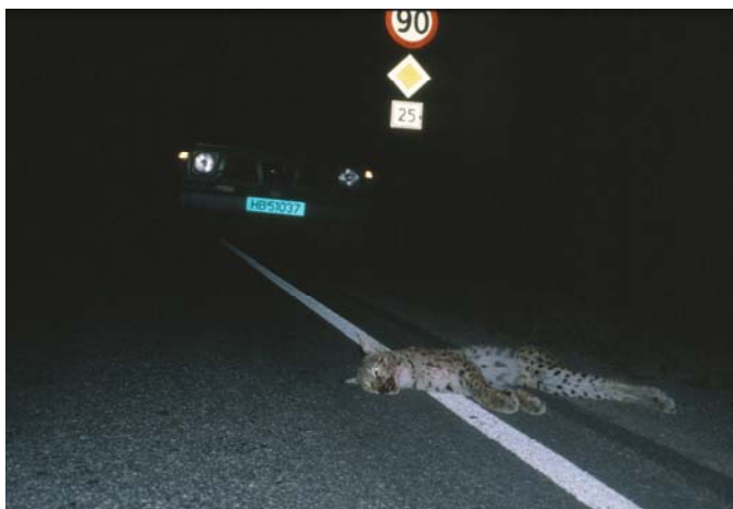
Denne gaupa ble påkjørt og drept sommeren 1998.

En metode for å finne spesielle konfliktpunkter vil være registrering av strekninger der mange dyr blir påkjørt. Dette er steder der det kan være behov for faunapassasjer eller andre tiltak som kan begrense risikoen for påkjørsler. NVDB inneholder i dag vegobjekttypen dyrepåkjørsel . Slik vi forstår det inneholder denne kun påkjørsler som omfatter personskaade. Vi anbefaler imidlertid en ny omfattende registrering av døde dyr langs veg, som kan kobles opp mot eksisterende vegobjekttype. Metoder for dette er beskrevet i Håndbok 242 (Statens vegvesen 2005). Metode for registrering må inkludere opplysninger om både art og lokalitet.