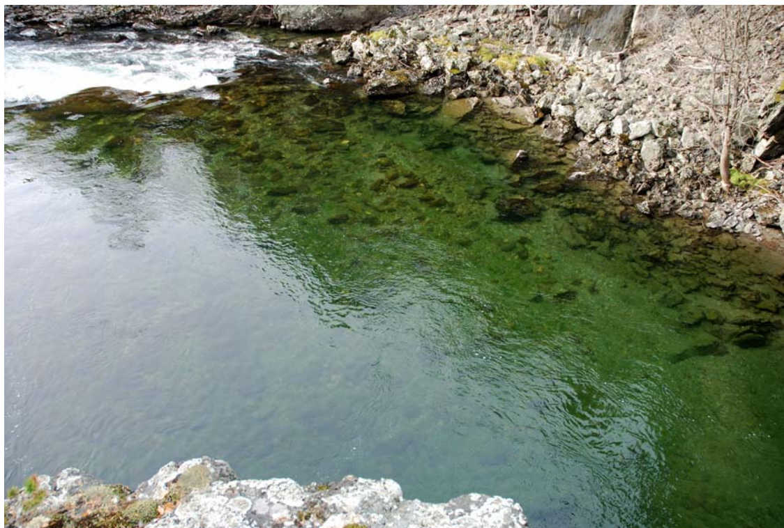
Figur 3. Potensielt gyteområde nedstrøms foss i Rostenfallene (ved rasteplass langs gamle E6)

Bestandene av ørret og harr innenfor influensområdet har til nå gitt grunnlag for betydelig sportsfiskeaktiviteter av betydelige lokal og regional betydning. Alle campingplassene langs elva har i tillegg hatt faste utenlandske fiskere fra Tyskland, Italia og Frankrike som har fisket etter begge artene i en årrekke både ovenfor og nedenfor Rosten.