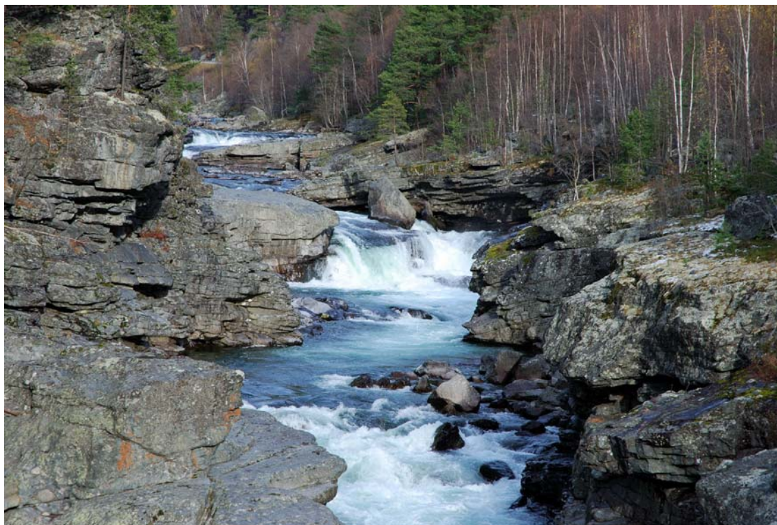
Figur 2. En av fossene i Rosten som antas å være vandringshinder for harr og hvor passering av ørret kan være vannføringsavhengig.

Rostenfallene består av strykstrekninger og fosser, men også av partier med både dype og grunnere kulper. Elva har utformet et trangt gjel med steile fjellformasjoner og rasmateriale. Etablering av E6 og jernbane har medført omfattende grad av massefyllinger langs store deler av strekningen på begge sider av elva. Enkelte av fossene i midtre deler av Rostenfallene kan være til hinder eller begrensende for harr- og ørretvandring. Det antas at særlig en av fossene virker vandringshindrende for harr ( Figur 2 ) og at passering av ørret trolig er vannføringsavhengig.