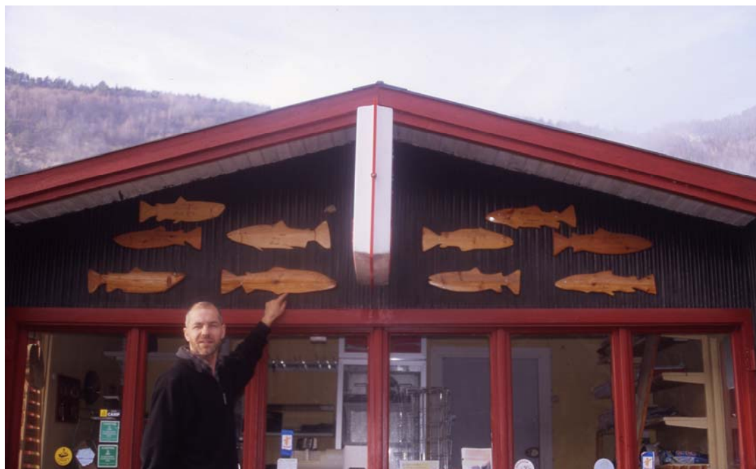
Figur 5. Ved Sæta Camping er det opphengt til sammen 10 utskårede ørreter på veggen til informasjonskiosken som er fanget i elva utenfor campingplassen.

I Ottaelva ved tunnelutløpet fra Eidefoss kraftverk er det et godt ørretfiske med mark i mars og april. Som et eksempel nevnes en god dagsfangst av ørret i månedsskiftet mars/april som bestod av 15 ørreter fra 300 g til 1420 g. Gjennomsnittsvekten ble anslått til 600 g. Videre nedover i Ottaelva er det dokumentert overvintring i følgende holer (registrerte arter i parentes); høl ved Tollstadskriu (tatt ørret over 3 kg), høl ved Øihusviken/Nordre Veggum (ørret), høl ved "storstein" ved Flåten (ørret og harr), høl ved Kleiven nord for Kleivsletten (ørret), høl nedenfor Åsårbrua og hølen ved grindom" nedenfor fallene ved Meisgård. Isgangen i Ottaelva antas å være såpass kraftig at dype holer også utgjør et refugium for fisk i alle alders- og størrelsesgrupper under isløsningen.