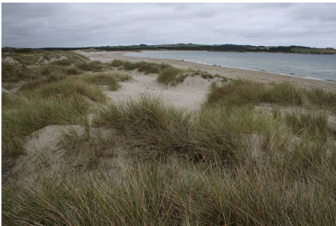
Sanddynelandskap med hvite dyner på Solastrand i Rogaland.

Truete arter, slik som strandmaurløve Myrmeleon bore , strandtorn Eryngium maritimum får nå egne handlingsplaner (Direktoratet for naturforvaltning 2010). Det er også på denne bakgrunn at det nå utarbeides en egen handlingsplan for sanddynemark som ser på sanddyneproblematikken under ett.