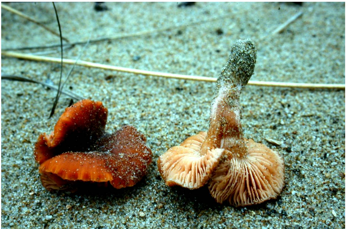
Eksempler på obligate sanddynesopper er dynesprøsopp Psathyrella ammophila (VU) øverst og dynelakssopp Laccaria maritima (EN) nederst.