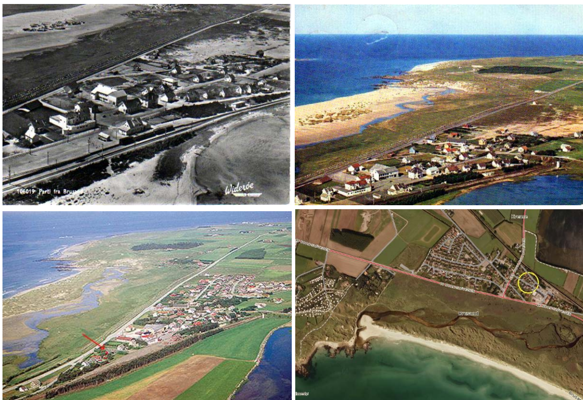
Figur 2. Brusand, Hå i Rogaland i ulike tidsperioder. De to øverste bildene er gamle postkort (Jæren kort – Per Otto Vold), trolig fra rundt 1950 og 1960. Legg merke til at området mellom elva og sjøen er nesten helt vegetasjonsløs. Det er også store sandfelter på innsiden av veien. De to nederste bildene viser hvordan området ser ut i dag på et lignende flybilde og på Norge i Bilder. Åpne sandområder finnes nesten bare på sand-forstranda, mens dynene innenfor er gjengrodd. Sandfeltene innenfor er dyrket opp eller utbygd.

Sanddyner i Norge utgjør forholdsvis små arealer og ligger ofte spredt i langs kysten (fig. 1), hvilket gir en naturlig fragmentert populasjonsstruktur for artene som lever der. Dette kan medføre for at selv mindre og lokale påvirkninger kan være negative. Hvis avstanden mellom delpopulasjonene blir for stor, f. eks. ved at sandområder i enkelte områder bygges ned eller endrer karakter, kan enkelte arter få problemer med å opprettholde naturlig spredning mellom delpopulasjoner. Dermed øker risikoen for lokal utdøelse av slike populasjoner. Larsson (2002) nevner eksempler på at visse grupper av veps (Hymenoptera) som er særlig utsatt for slike hendelser. Det er flere ulike årsaker til at arealene med sanddyner har gått tilbake og at områdenes habitatkvalitet kan forringes.