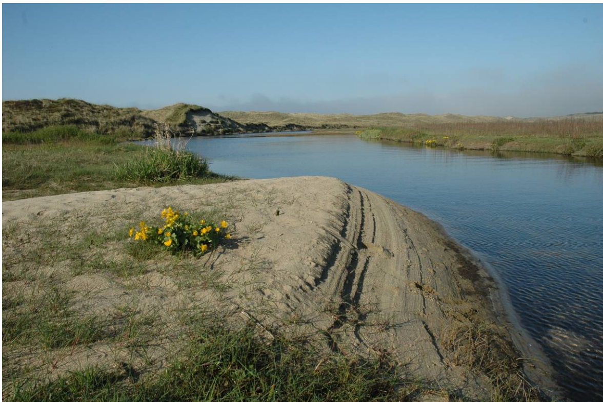
Hvite dyner på Lista i Vest-Agder (øverst) og Vaulen ved Brusand på Jæren (nederst) der ferskvannsinnsig gir grunnlag for ulike fuktpregete naturtyper som dynetrau.