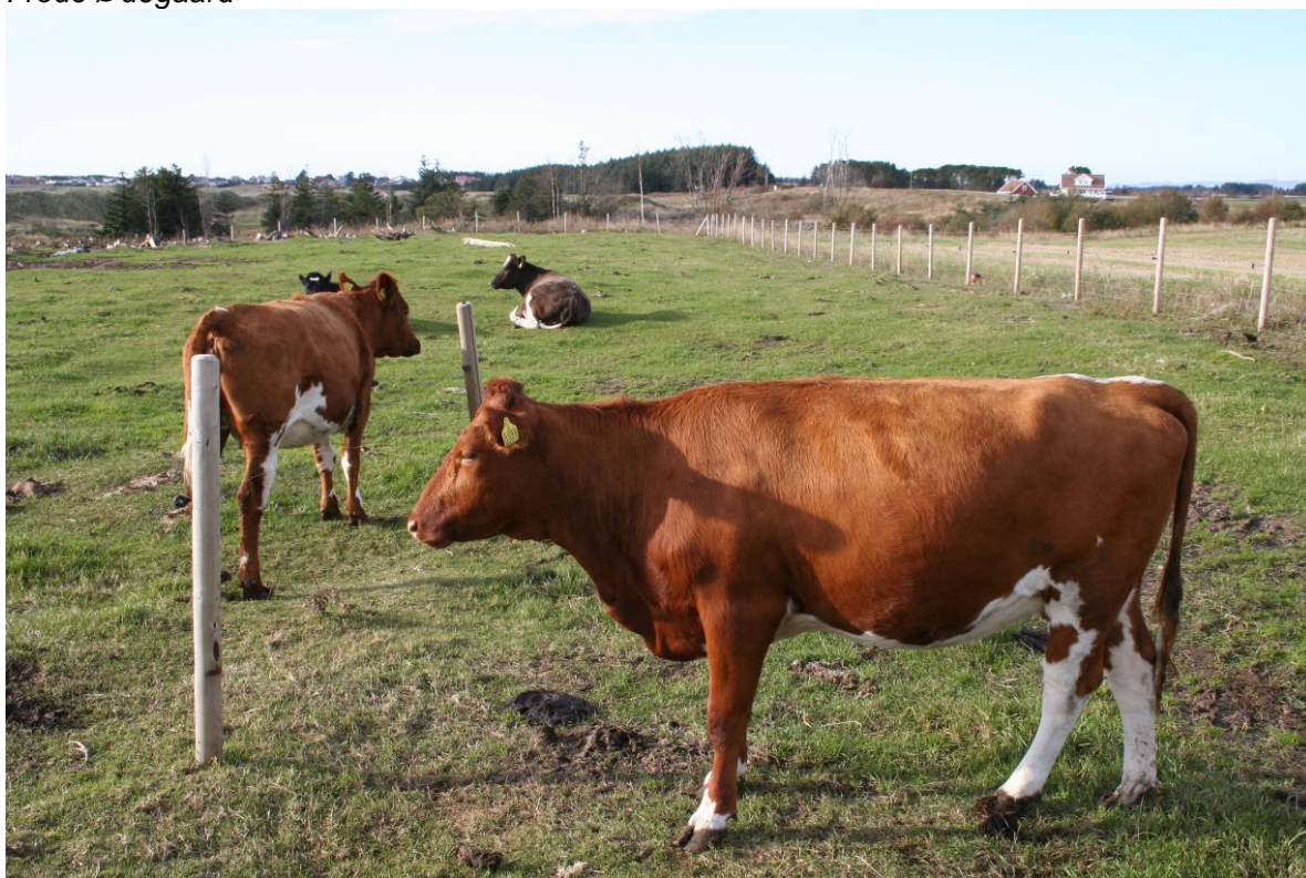
Beiting av storfe i tilknytning til sanddyneområder ved Nordhasselstrand på Lista i Vest-Agder. Dyremøkk er et viktig livsmedium for flere arter av rødlistete møkkbiller.