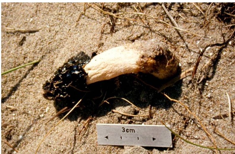
Sandstanksopp Phallus hadriani (CR) er en av våre aller sjeldneste og mest truede sanddynearter.

Dynesprøsopp Psathyrella ammophila (VU) og sandstanksopp Phallus hadriani (CR) er de to mest ekstreme sandspesialistene blant soppene, og begge er knyttet til marehalm. De andre obligate sanddynesoppene, dynelakssopp Laccaria maritima (EN), dynetrevlesopp I. dunensis (VU), strandtrevlesopp Inocybe impexa = I. lacera var. maritima (EN) og blek sandtrevlesopp I. serotina , incl. I. devoniensis (EN) forekommer også gjerne i åpen sand, men har trolig som regel kontakt med krypvier-planter. Også enkelte "nesten-obligate" sanddynesopper er rødlistet, bl.a. de to sjampinjong-artene kopperbrun sjampinjong Agaricus cupreobrunneus (VU) og Agaricus devoniensis (VU), samt trevlesoppen Inocybe vulpinella (DD). Grann styltesopp Tulostoma brumale (EN) har også en betydelig andel av sine forekomster på sanddyner. Til sammen er 14 sanddynesopper rødlistet i rødlista for 2010 (Kålås et al. 2010). De fleste kjente forekomstene av disse er på Lista- og Jærstrendene, og disse større, velutviklede sanddynesystemene utgjør således et viktig hotspot-habitat for rødlistete, jordboende sopparter. Sanddynerne huser også et element av mer alpine sopper, som i fjellet opptrer i tilknytning til dvergvierarter, og på sanddyner med krypvier. Disse opptrer gjerne i mer etablerte dynetrauer.