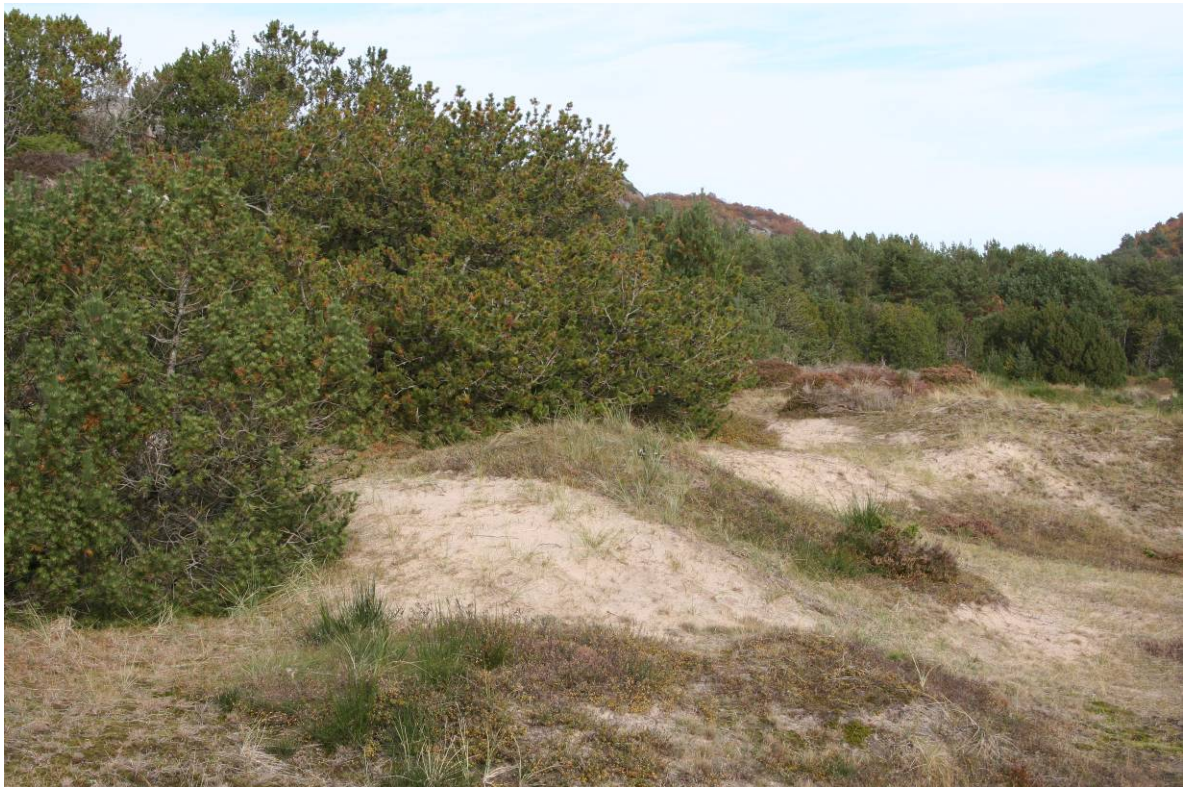
Fremmede arter er et en viktig årsak til gjengroing av sanddynemark. Gyvel (øverst) og buskfu- ru (nederst) dominerer i mange områder som her ved Lomsesanden på Lista i Vest-Agder.