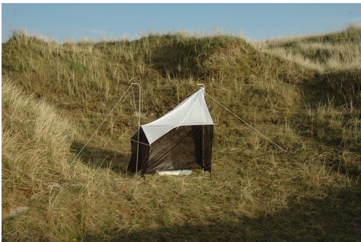
Kartlegging av insekter på sanddynemark ved Brusand på Jæren, Hå i Rogaland. Nedsetting av fallfeller for fangst av marklevende insekter (øverst) og malaisefelle for fangst av svermende insekter (nederst).