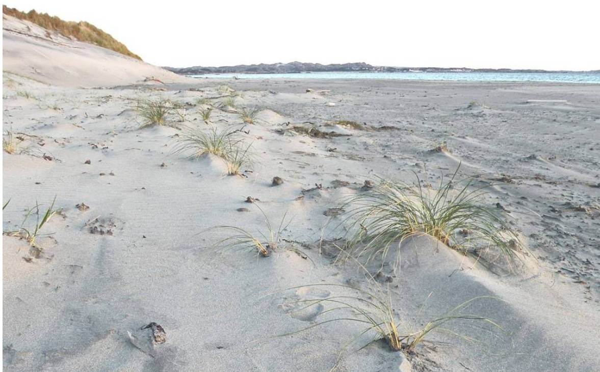
Sand-forstrand a) Ørekroken på Hvaler i Østfold, med tydelige vegetasjonssoneringer, og b) ved Brusand, Hå i Rogaland der spretthalen Paraxenylla norvegica som ble funnet ny for vitenskapen i 2009.