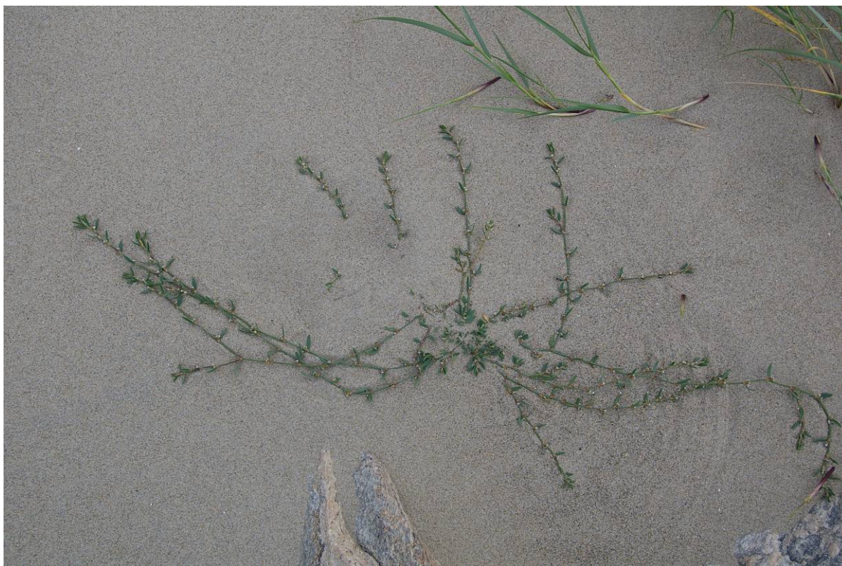
Dansk sandslirekne Polygonum raii ssp. raii er en av våre sjeldneste karplanter.

Det kan være en utfordring å nå ut med slik informasjon, og det bør vurderes hvilke former som er mest egnet i forhold til målgruppene. Ofte vil et samarbeid med lokale foreninger, som Naturvernforbundets lokallag, historielag, lokallag av ulike naturrelaterte foreninger være nyttig når det gjelder tiltak rettet mot allmennheten og grunneiere.