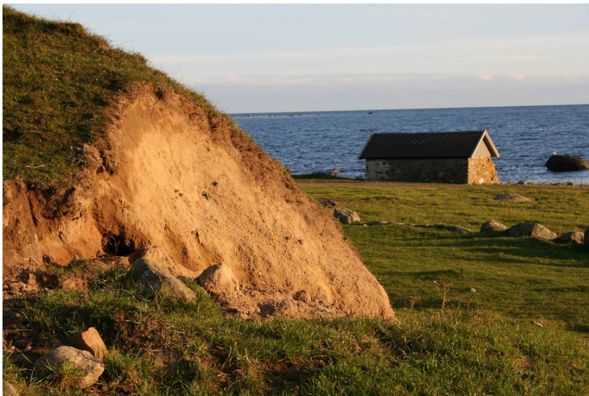
Beiting er en viktig forstyrrelsesfaktor for å hindre gjengroing og åpne vegetasjonsdekket. Slike eksponerte skrenter er viktige reirplasser for en rekke arter av broddveps som her på Østhas-selstrand på Lista i Vest-Agder.

Det er grunn til å tro at forvaltningen av kystsanddyner i Norge hittil ikke har iverksatt tiltak som gir tilstrekkelige muligheter for å opprettholde tidlige suksesjonsfaser, men i det store og hele er av konserverende art med tiltagende gjenvoksning som resultat. Bevaring av høyt arts- mangfold knyttet til tidlige suksesjonsfaser er imidlertid en vanskelig balansegang mellom snikende gjenvoksning og slitasje/erosjon (Larsson 2002). Flere forfattere peker på at et moderat beite- trykk av sau og storfe gir et optimalt forstyrrelsesregime.