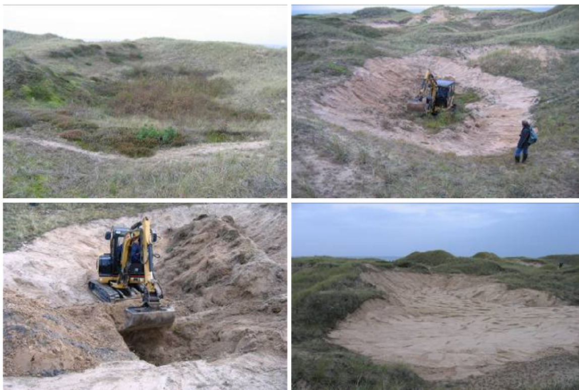
Figur 3. Restaurering av sanddyner i Halland i Sverige. Hentet fra Persson (2008).

Gjengroing er som tidligere nevnt en av de største truslene i sanddynemark. Gjengroingen starter gjerne med at bunnsjiktet dekkes med moser og grasarter blir mer dominerende. Etter hvert ser man tiltakende forbuskning. I dynetrauene fortettes vegetasjonen og pusleplantene fortreges av høyvokste planter som takrør. Tradisjonell skjøtsel innebærer ofte å fjerne busker og kratt for hånd, og eventuelt med kjemisk behandling av stubber og røtter. Dette vil fortsatt være aktuelle tiltak, men for å gjenskape åpne sandflater og intakte dynetrau vil det kunne være aktuelt stedvis å fjerne vegetasjonsdekket mekanisk gjennom graving (fig. 3). Fra Sverige begynner man nå å få god erfaring med slik skjøtsel ved at man oppnår raske positive bestandseffekter på sandlevende arter (Berglind 2004). Denne type skjøtsel kan gjøres på flere måter og bør testes ut i mindre skala i starten for å opparbeide erfaring. Siden mange av artene i sanddyner prefererer soleksponerte skrenter på våre breddegrader, kan en strategi være å skalle av flekker i sydvendte hellinger i dynelandskapet. Dette er også gunstig siden skrenter vil være mer ustabile, noe som vil forsinke gjengroingsprosessen. Det er også en fordel at områdene som avskalles ligger noe skjermet for vindeksponering for eksempel ved å sette igjen en levegg med trær i overkant av sandflata der dette finnes. Et viktig tiltak for nesten alle taksonomiske grupper vil være å restaurere dynetrau der disse har gått tapt (Rhind & Jones 2009).