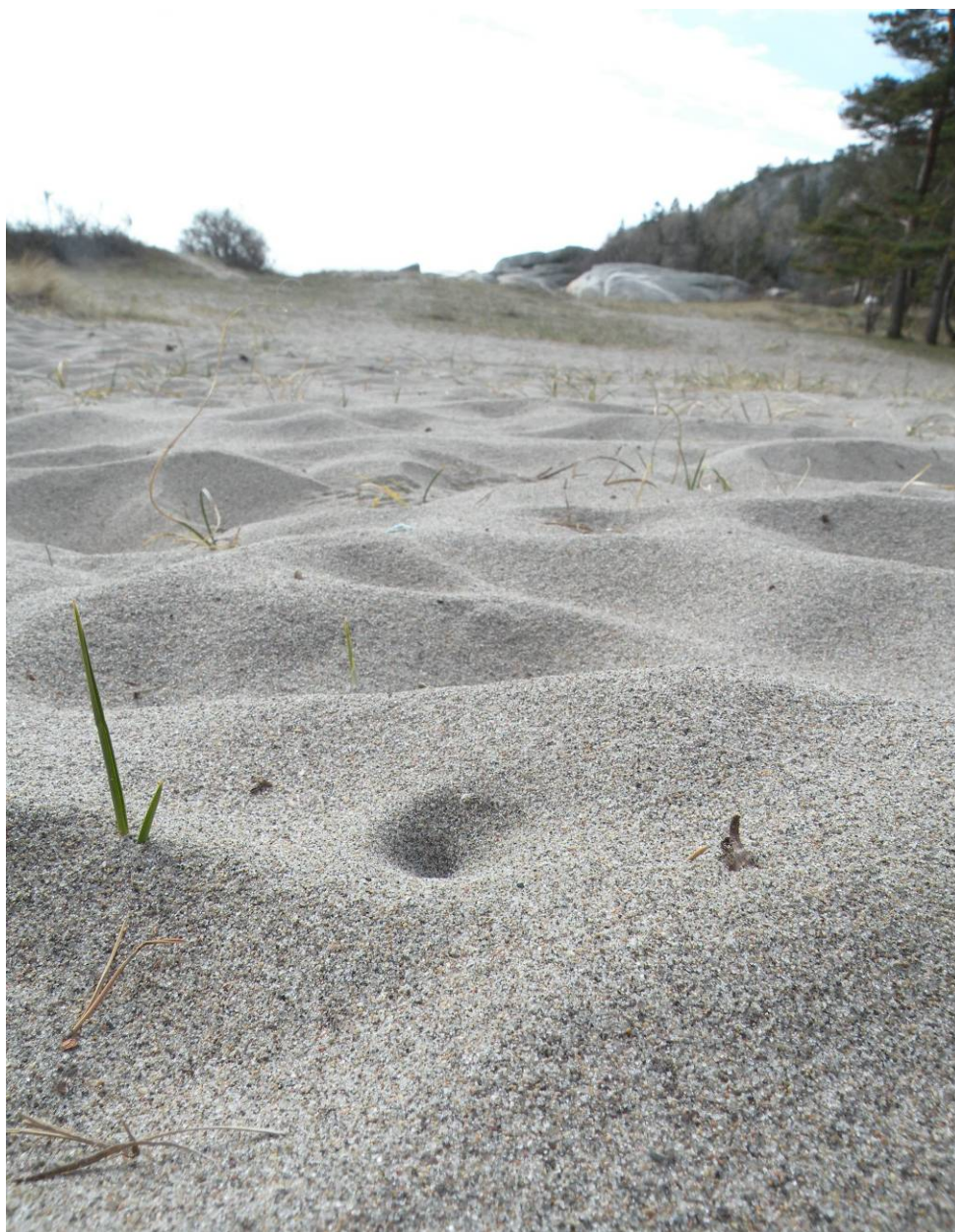
Fangstgroper av sandmaurløve Myrmeleon bore danner er karakteristiske spor i sanddyne- mark rundt Oslofjorden.

Det legges i første rekke opp til overvåkingsopplegg som tar sikte på å følge areal- og kvali- tetsutviklingen av naturtypene, samt strukturer og prosesser. Overvåking av enkeltarter eller enkle artssamfunn vil være tema for separate handlingsplaner. Et fullstendig overvåkingsopp- legg for landskap, naturtyper og arter er beskrevet for Sverige i Larsson (2002).