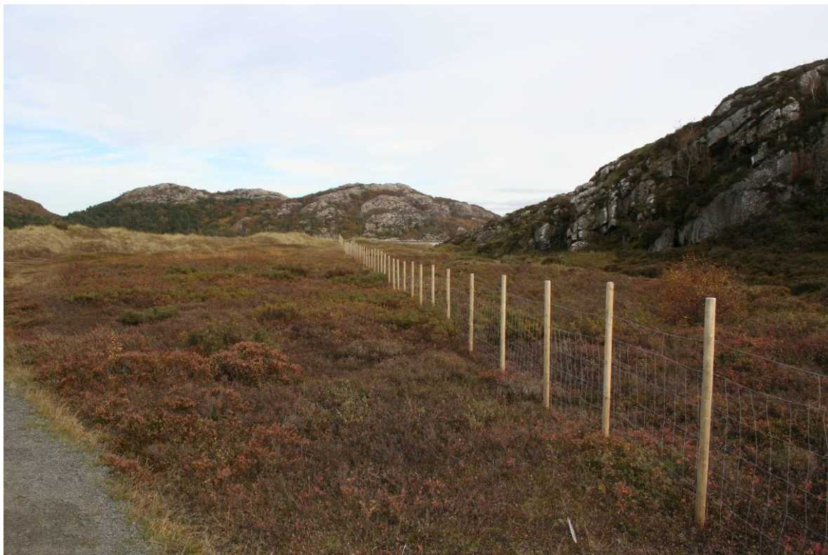
Moderat beiting er et skjøtselstiltak som allerede er i bruk i enkelte sanddyneområder som her ved Einarsneset på Lista i Vest-Agder der deler av arealene blir beitet med steinaldersau.