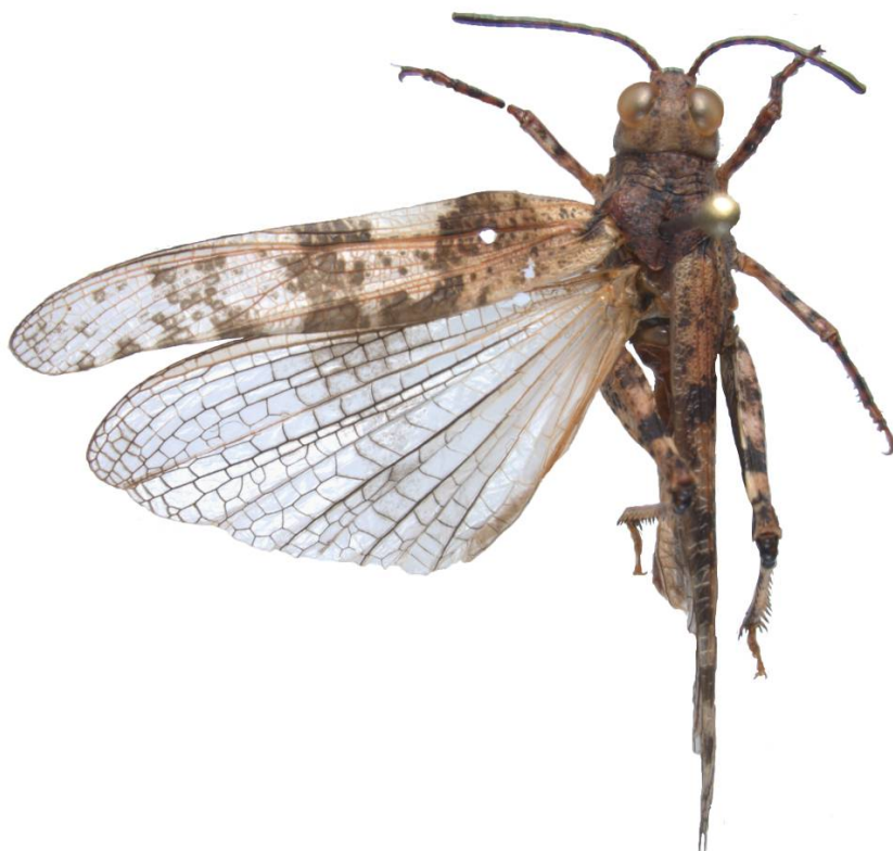
Blåvingegresshoppe Sphingonotus caeruleus (VU) finnes på sanddynemark rundt Oslofjorden.