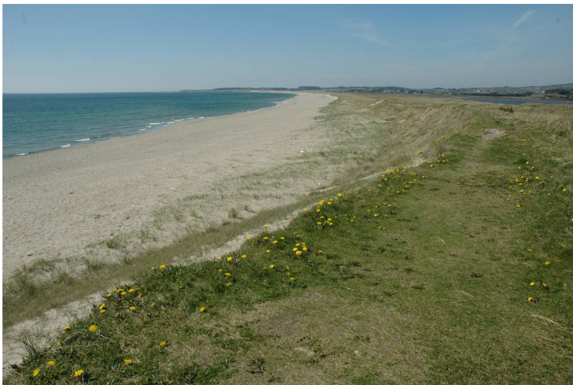
Sanddynemark ved Oгна på Jæren, Hå i Rogaland.

Aktive kystsanddyner er viktige naturtyper som dokumenterer landformdannende prosesser. Slike områder er registrert i forbindelse med arbeid med kvartærgeologiske verneplaner i Norge (Erikstad 1994), et arbeid som ikke er fullført. De største og viktigste aktive sanddynekompleksene finnes på Jæren og ved Lista (Rogaland og Vest-Agder), men fine sanddynekompleks finnes langs hele kysten ikke minst i de tre nordligste fylkene.