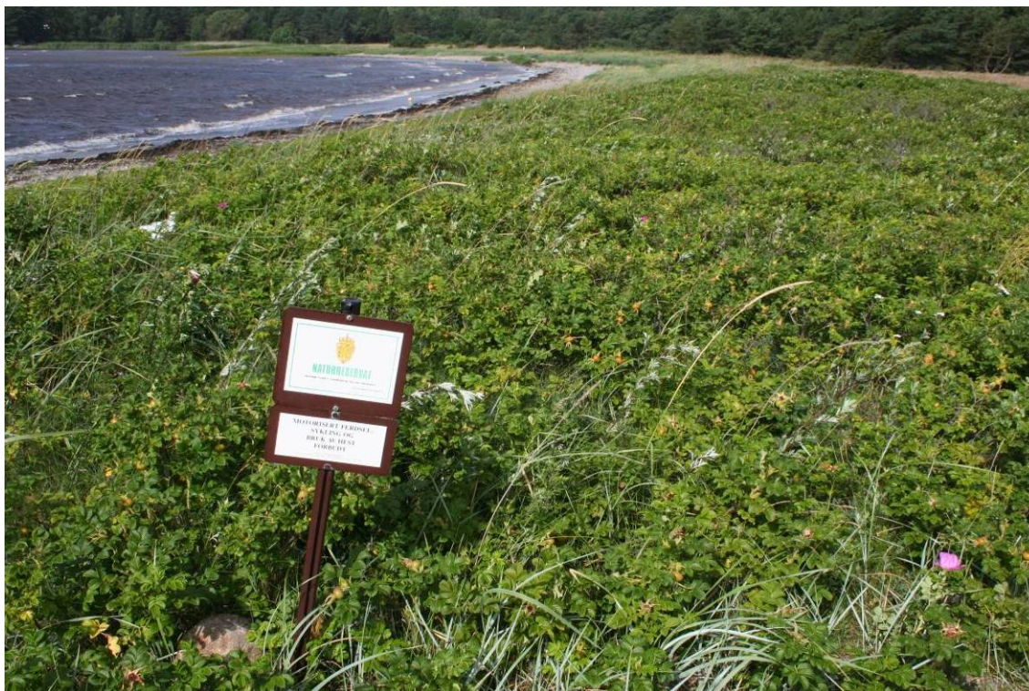
Rynkerose er en fremmed art som kan ha stor innvirkning på miljøforholdene på sanddyne-mark ved at den okkuperer store arealer som her ved Ørekroken på Hvaler i Østfold.

Planting og spredning av fremmede bartrær (buskfuru, bergfuru kvitgran og sitkagran) for å stoppe sandflukt og skjerme for vind langs kysten har vært svært omfattende i mange områder f. eks. på Lista og Jæren. Gjengroing med furu er derfor omfattende i bakkant av sanddynene.