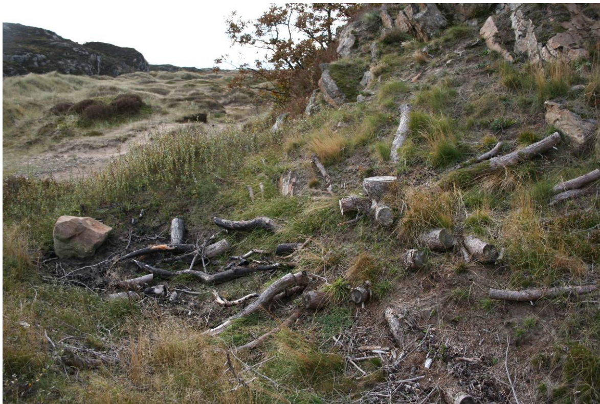
Fjerning av buskfuru ved Lomsesanden på Lista i Vest-Agder er et viktig tiltak for å hindre gjengroing.

Mange av sanddyneområdene i Norge er i dag fredet etter naturvernloven. Listastrendene ble fredet som landskapsvernområde ved kgl. Res. 28.08.87. Totalt er det 14 delområder innen dette verneområdet. Ett år etter fredningen startet en opp arbeidet med forvaltningsplan for landskapsvernområdet som ble godkjent av Fylkesmannen i 1995 (Benestad & Vikøyr 1995). Jærstrendene ble vernet i første omgang i 1977, deretter med revidert vern i 2003. En ny forvaltningsplan som deler inn Jærstrendene i 37 ulike soner er nå på høring (Fylkesmannen i Rogaland 2010).