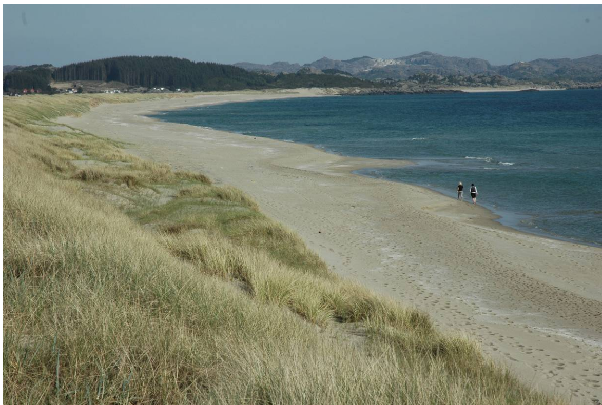
Sanddynemark ved Oгна på Jæren, Hå i Rogaland.