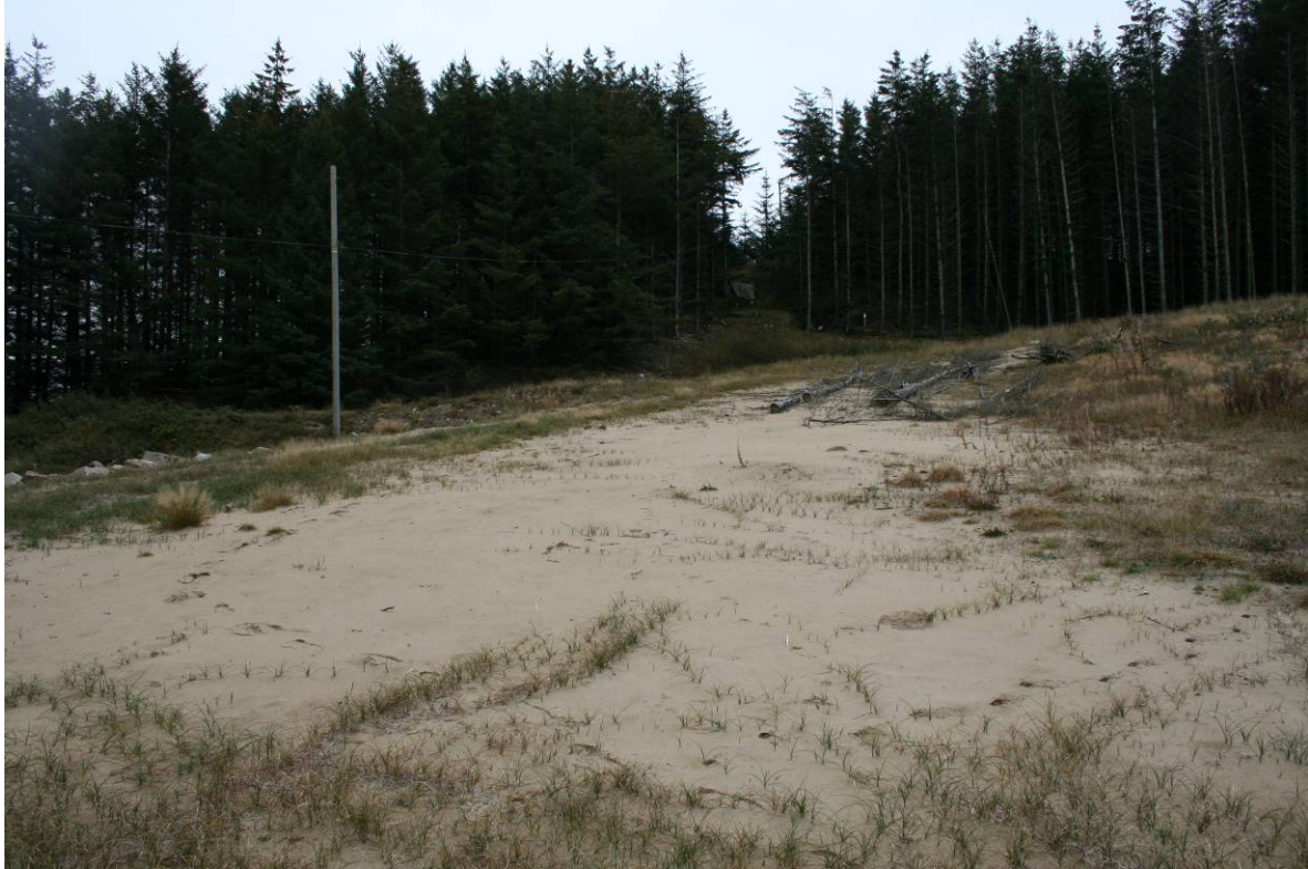
Leplantasjer av f. eks. sitkagran er vanlig i områder nær sanddynemark som her ved Oгна på Jæren, Hå i Rogaland.

Lebelter med buskfuru, bergfuru kvitgran og sitkagran har vært anvendt i stort omfang for å stoppe sandflukt og skjerme for vind langs kysten. Slik planting inne på sanddynene vil bryte den naturlige dynamikken og føre til endring av fysiske forhold og artssammensetning. Det tykke laget med nålestrø under slike trær setter en effektiv stopper for arter som er avhengige av åpne sandfelt. Fjerning av slike leplantninger er ett av flere iverksatte tiltak for å berge strandtornbestanden på Lista (Svalheim & Pedersen 2007).