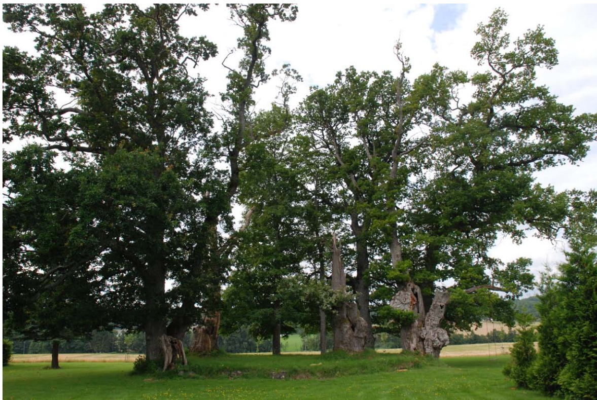
Figur 32. En sirkel av gamle eiker ved Østre rom gård i Tønsberg kommune.

Kroks-Rom (ved Østre Rom) ( Figur 32 og 33 ) 4/8 2011