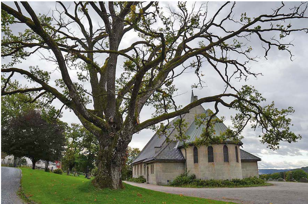
Figur 24. En stor eik ved Borgestad kirke i Skien kommune.

Under følger kommentarer til alle undersøkte lokaliteter i 2011 gruppert etter kommune.