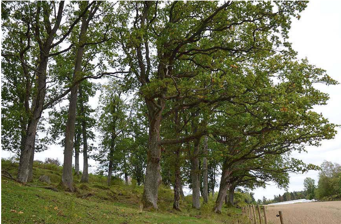
Figur 37. En eldre eikelund ved Aker gård i Tønsberg kommune.

Eldre eikelund SØ for gården som består av ca. 45 trær. Blant disse ble det notert 3 trær med synlige hulheter og rød muld. Åpningene ligger til dels nede ved bakken, og de tilgjengelige hulrommene hadde ingen spor tegn etter store skarabider. Eikelunden på Aker gård synes å være i litt for ung fase for arter knyttet til hule trær ennå. Den vil i framtiden kunne bli et viktig habitat, men bare temporært etter som kontinuiteten av denne naturtypen i området ser mindre god ut.