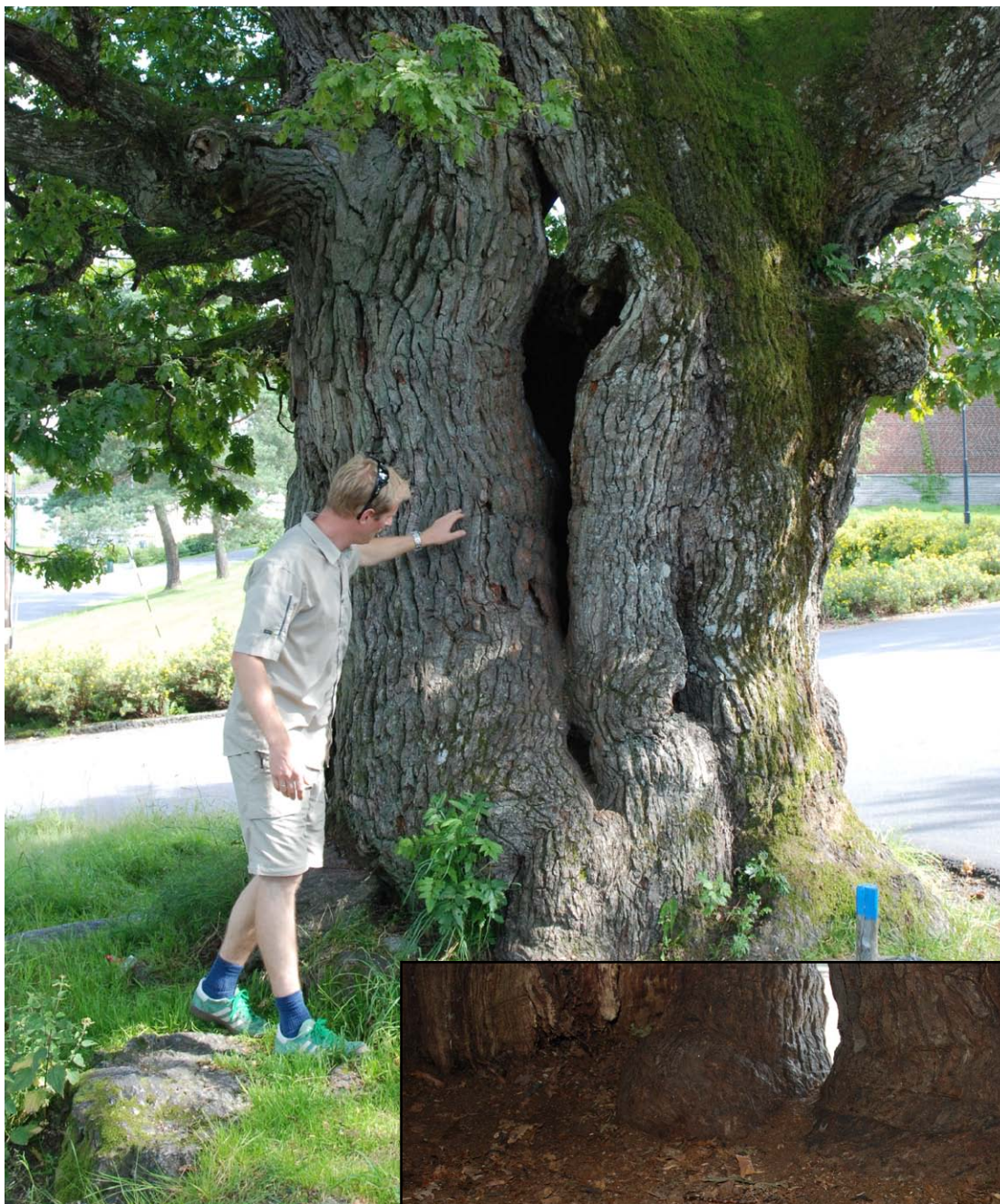
Figur 27 og 28. En enslig eik ved Rødsåsen i Sandefjord kommune. Stor hulhet, men den er flattråkket.

En enslig stor og hul eik står ved krysset mellom Ferjev., Øvre Huvikv. og Kirkev. Et stort hulrom inne i treet har mye rød muld, men blir brukt som lekeområde og bunnen er dermed flattråkket og uten spor etter ekskrementer av store skarabider.