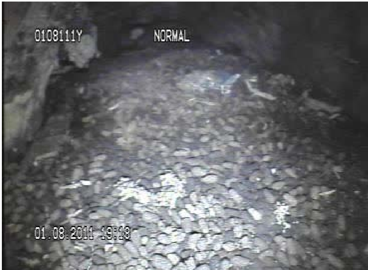
Figur 10. Typisk larvemøkk fra eremitt observert i hult tre med feierkamera.