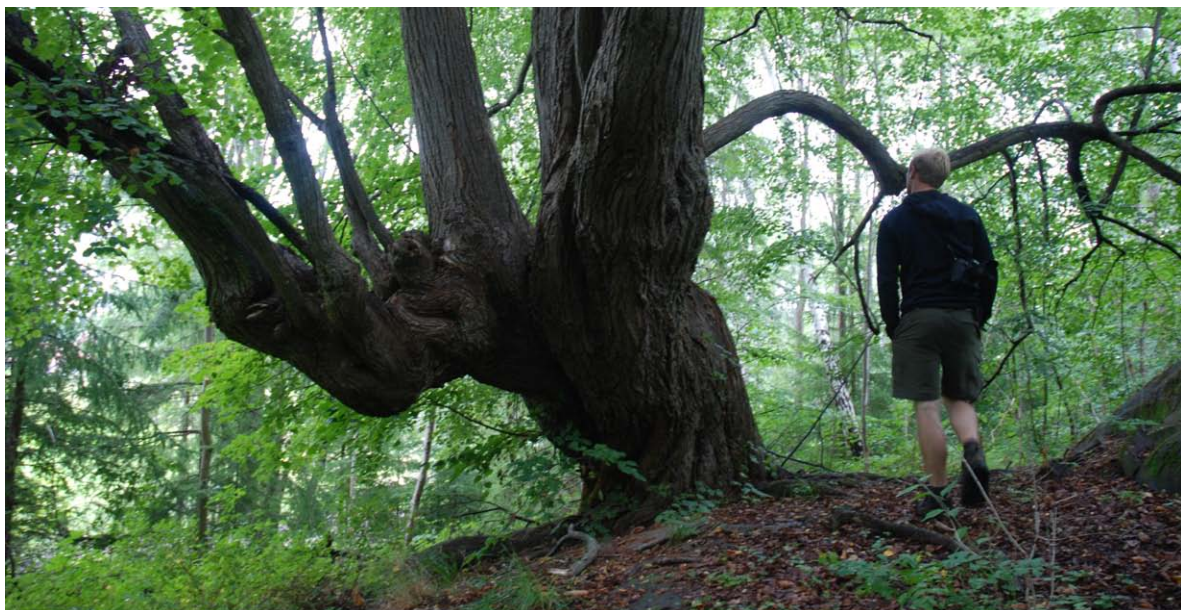
Figur 35. En stor og grov lind (c), som også synes å være hul, men mangler åpninger for nærmere undersøkelse.