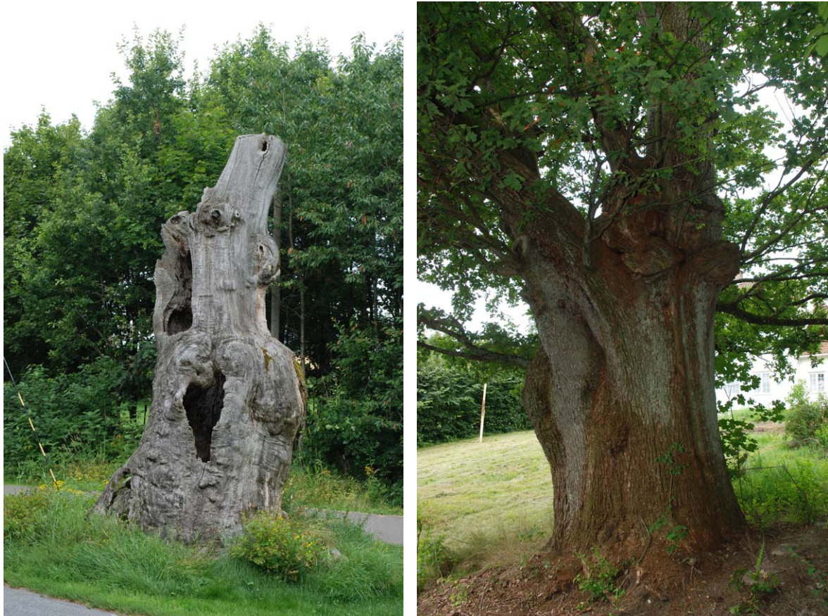
Figur 30 og 31. Den karakteristiske store og døde eikestubben (venstre) i vegkanten ved Nordre Eik i Tønsberg kommune. Til høyre en annen stor eik fra samme område.

Teigen 4/8 2011 Arnstein Staverløkk, Oddvar Hanssen UTM 32V: E584111N6579091