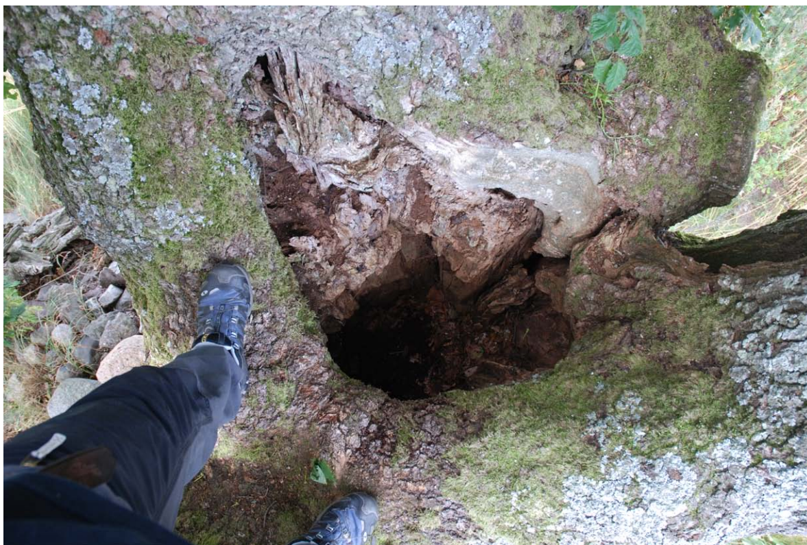
Figur 2. Inspeksjon av hult tre ved Teigen i Tønsberg.

Hoveddelen av feltarbeidet i 2011 ble, som i 2010, utført i august. Det har i tillegg vært supplerende undersøkelser gjennom hele sesongen, samt som nevnt over, kartlegging av vintersprekker vinterstid.