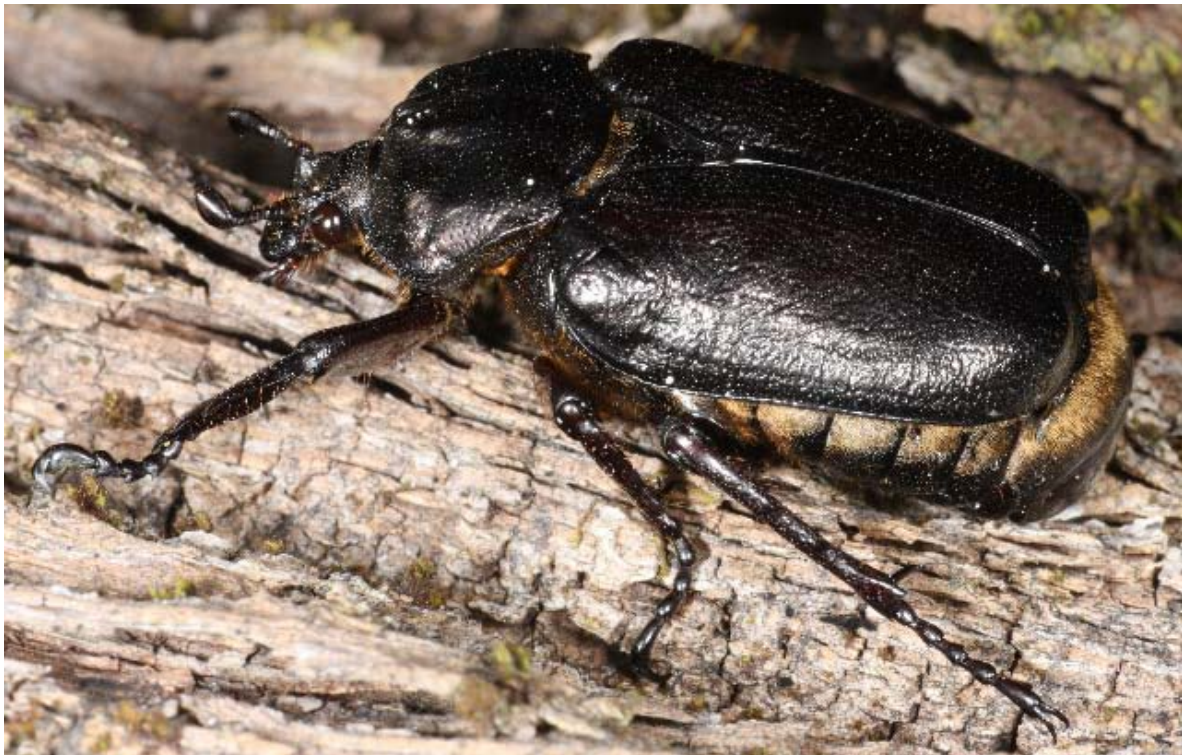
Figur 1. Eremitten Osmoderma eremita (Scopoli, 1763). En hann avfotografert på Tønsberg gamle kirkegård 6. august 2009.

Denne rapporten beskriver resultatene av kartlegging og overvåking av eremitt i 2011. Arbeidet har vært inndelt i tre deloppdrag; 1) Tønsberg gamle kirkegård (kartlegging og overvåking), 2) Strategi og plan for utsetting av eremitt på nye eller tidligere kjente lokaliteter, og 3) Søk etter arten utenfor Tønsberg gamle kirkegård.