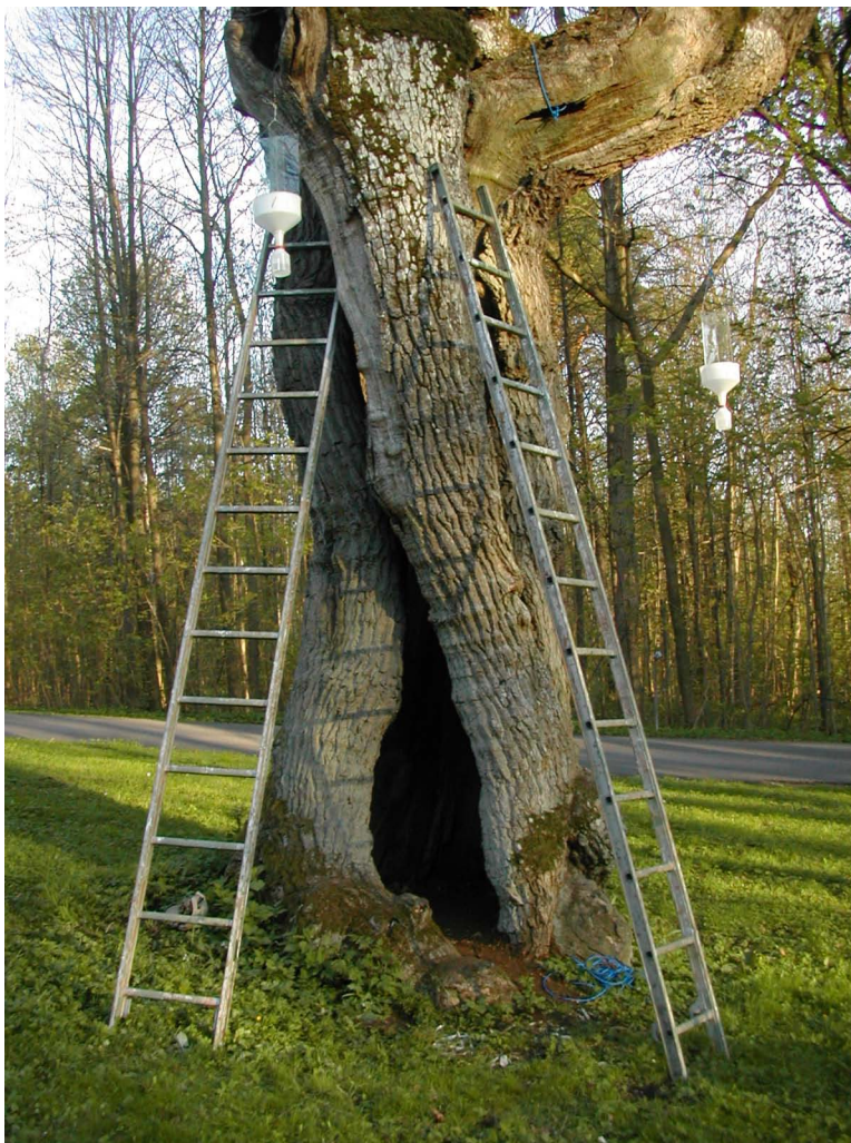
Figur 39. En av eikene på Karljohansvern i Horten med såkalt «skilderhus-åpninger».

Hortensskogen, som grenser inn til dette parkområdet i sørøst, og som er plante- og dyrefredningsområde, ser spennende ut entomologisk på grunn av sitt relativt store areal (210 da). Den er lite undersøkt med hensyn til entomologi. Skogen har en relativt god aldersvariasjon og sijkning, også med flere grove lauvtrær, noen og med hulrom og muld i (Røsok 2010). Det ble observert en stor lønn med rød muld ca. 80 m sør for parken, men med tett skog rundt. Vi har ikke søkt gjennom hele denne skogen med hensyn til hule trær.