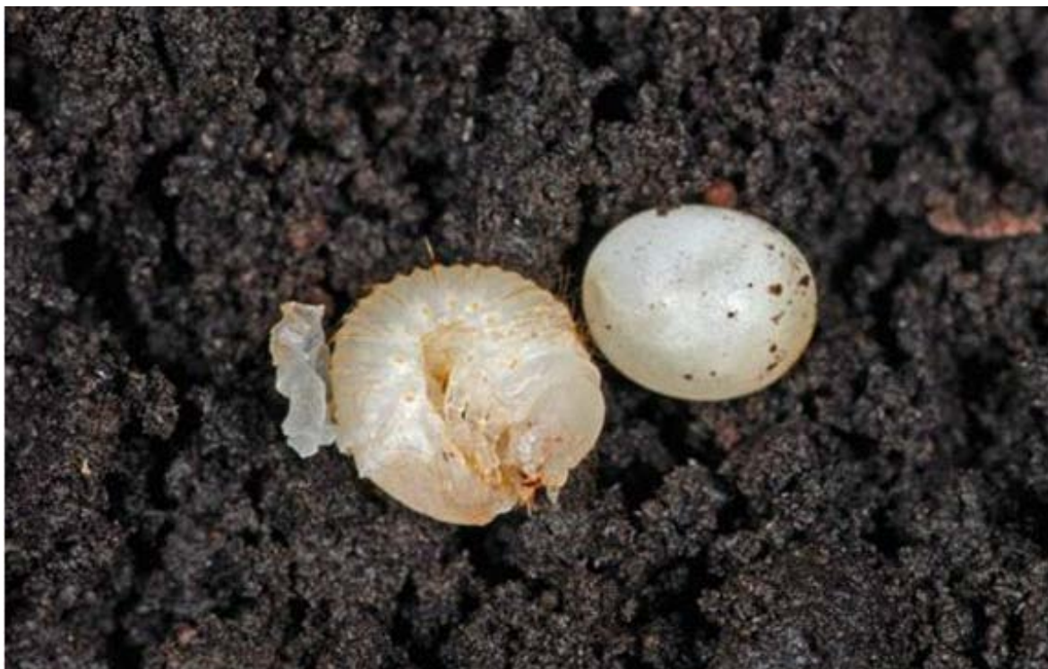
Figur 16. Eremitt-larve med «eggeskall» og egg av eremitt fra ask nr. 1-9.

skap. Dette bør vurderes på bakgrunn av et avlsprogram basert på en litteratur-gjennomgang og andre undersøkelser/erfaringer for å avklare best mulig fremgangsmåte. En avlspopulasjon basert på få individer bør tilføres nye individer årlig, både for å øke genpoolen og for å oppnå alle årsklasser i samme bestand.