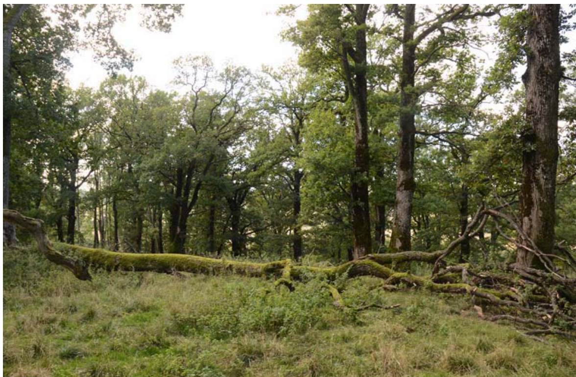
Figur 36. Den gamle eikehagen ved Berg Fengsel i Tønsberg kommune.

Eikehagen som den ved Berg Fengsel (a) er sjelden i norsk sammenheng (Hanssen & Hansen 1998). Den ligger i det nordvestre hjørnet av fengselets arealer, og består av til sammen 60-70 mer eller mindre gamle eiker, omgitt av noe beitemark for sau. Til sammen er det nok 10-15 av trærne i lunden som er muldrike, men mange av dem har bare små sprekker som det ryr litt muld ut av pga. mauren Lasius brunneus .