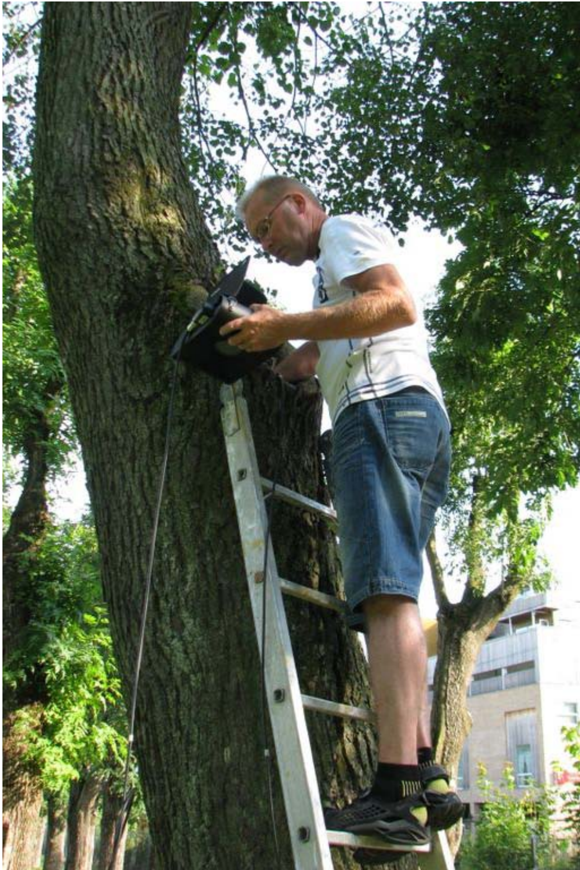
Figur 3. Bruk av feierkamera for å undersøke hulheter i trær.