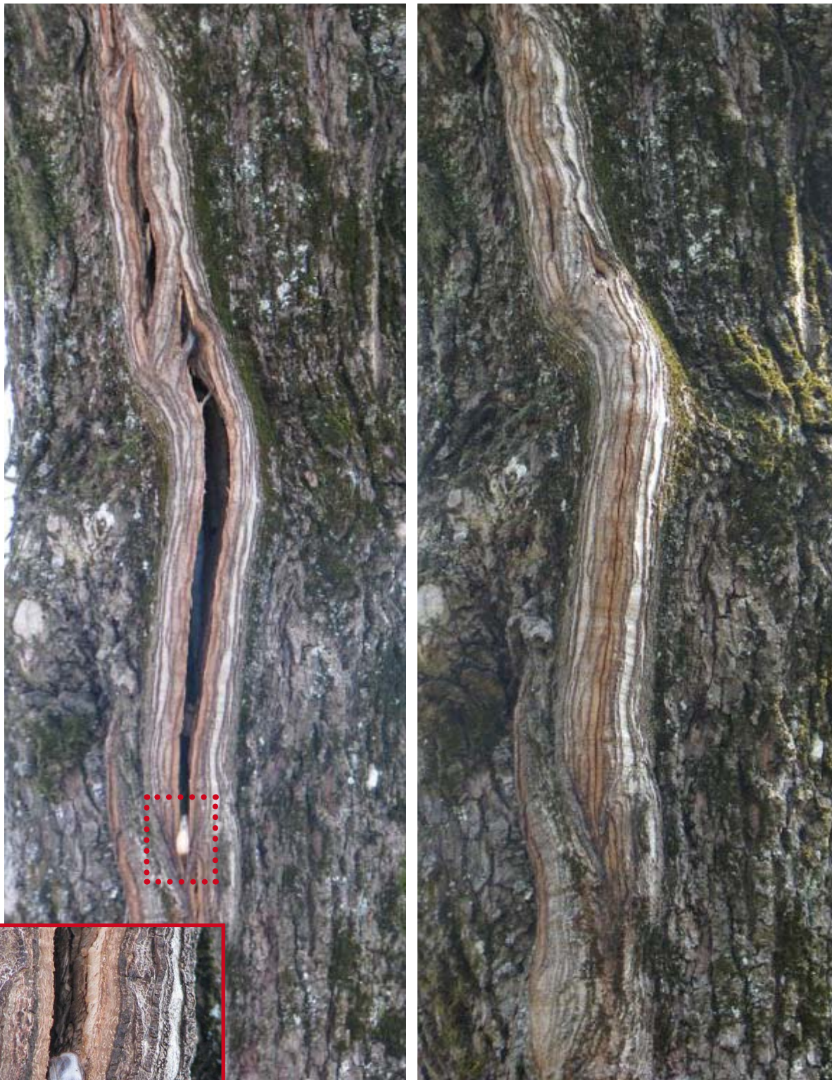
Figur 6-8. Øverst til venstre ser man tre 02-07 med vintersprekk. En larve er satt seg fast i bunnen av sprekken etter å ha rast ut med mull (se innfelt bilde). Til høyre ser man samme stammen på sommertid, og da er sprekken lukket.