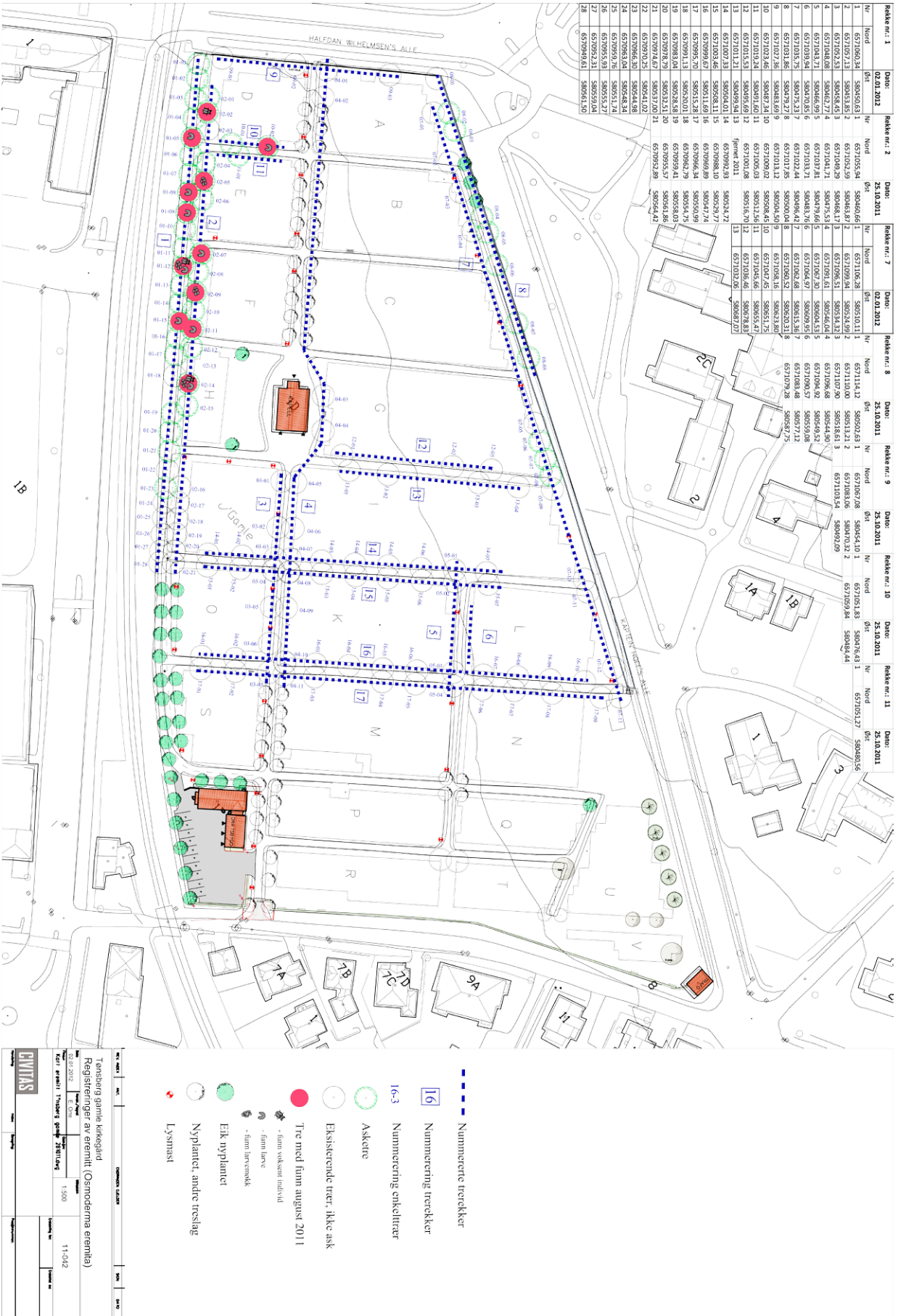
Figur 14. Kart over trær på Tønsberg gamle kirkegård. Kart: Civitas.