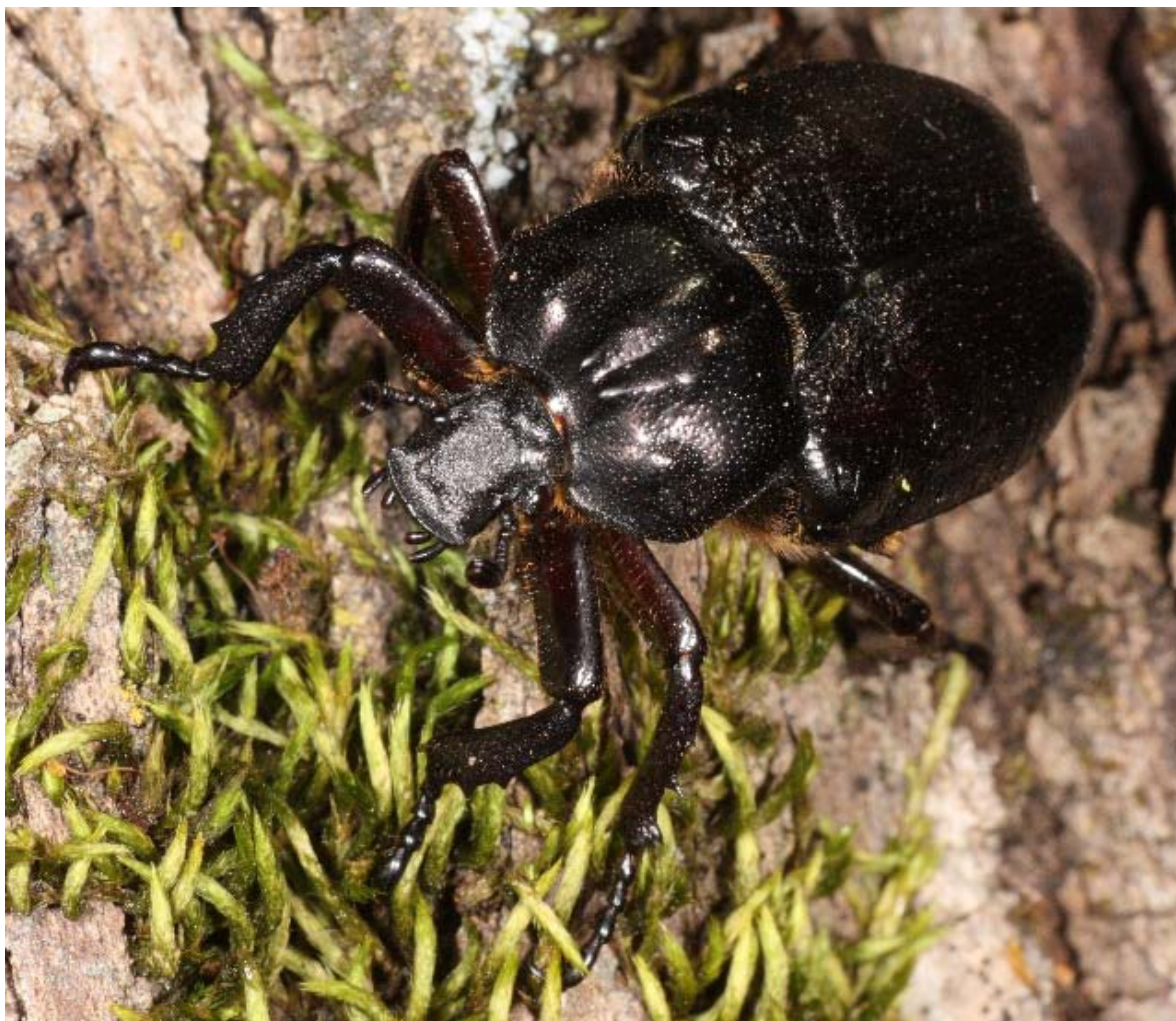
Figur 18. Det er vanskeligere å påvise voksne individer av eremitt enn larver, og i 2011 ble kun et voksent individ observert. Avbildet individ er fra Tønsberg gamle kirkegård 6. august 2009.