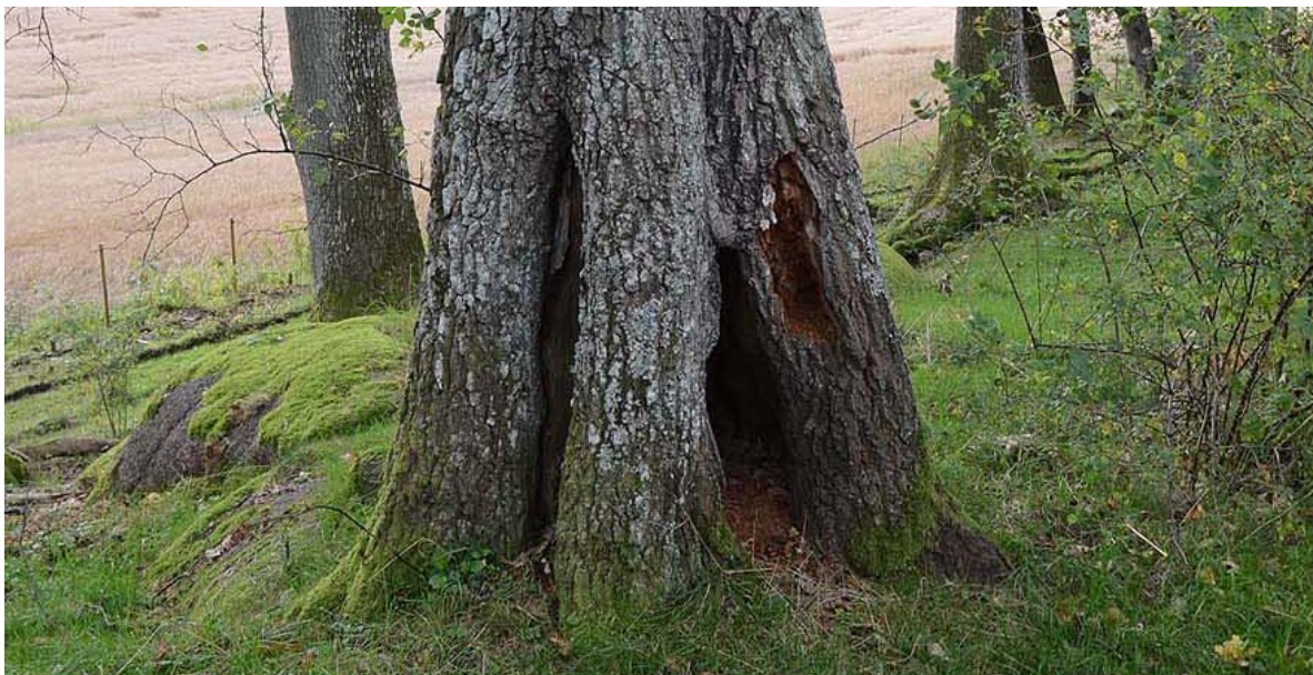
Figur 38. Noen få trær på eikelund ved Aker gård i Tønsberg kommune har synlige hulheter og muld.