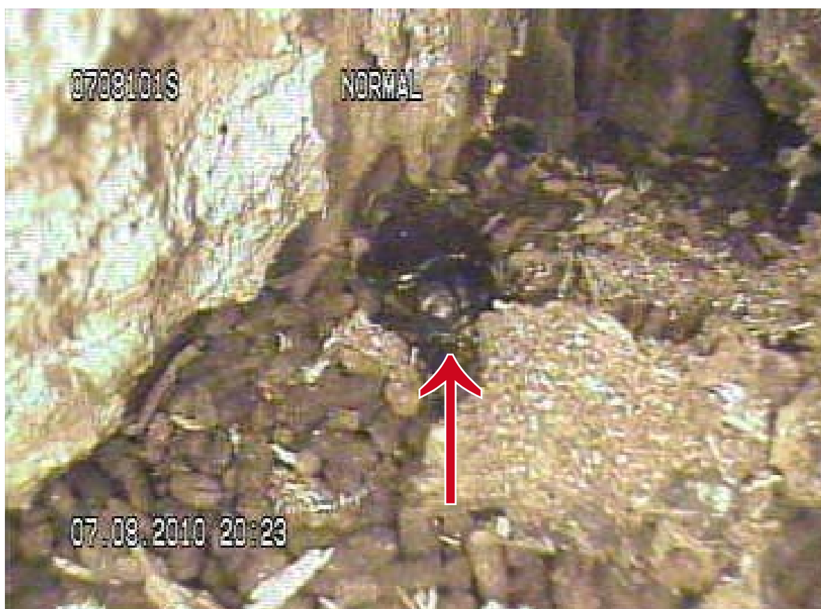
Figur 13. En voksen eremitt observert med feierkamera på Tønsberg gamle kirkegård i 2010.