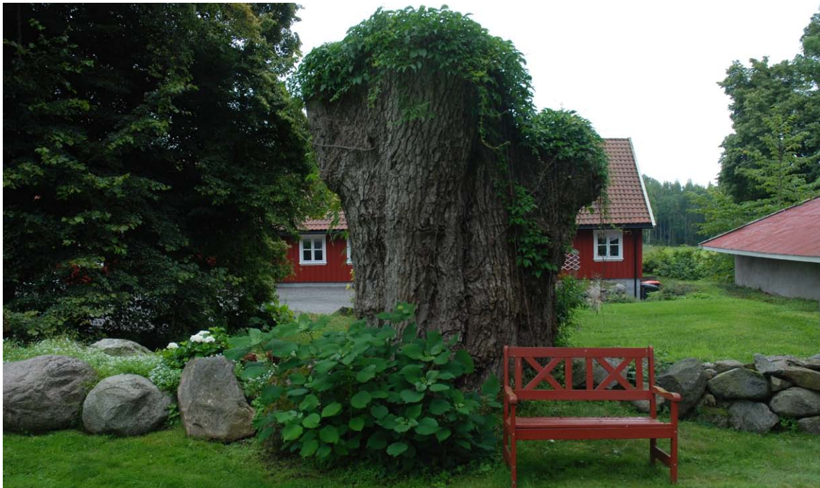
Figur 34. En grov eikestubbe (e) ved Karlsvika gård i Tønsberg kommune.

To hule kjempeeiker (a) står ca. 150 m SØ for gården, og ytterligere en tredje hul kjempeeik (b) står 100 m SØ for de første. Alle tre har store åpninger 1,5-2 m over bakken, og en god del rødmuld. Ingen ekskrementer eller andre spor etter våre største skarabider ble funnet. Inne i skogen, like NØ for den tredje eika, står en stor og grov lind (c), som også synes å være hul, men mangler åpninger for nærmere undersøkelse. Flere grove linder (d) står ved gården og i skogen rett sør for gården, og i tillegg en grov eikestubbe (e) på tunet som var overvokst av villvin. Det ble ikke funnet partier med tilgjengelig muld på disse.