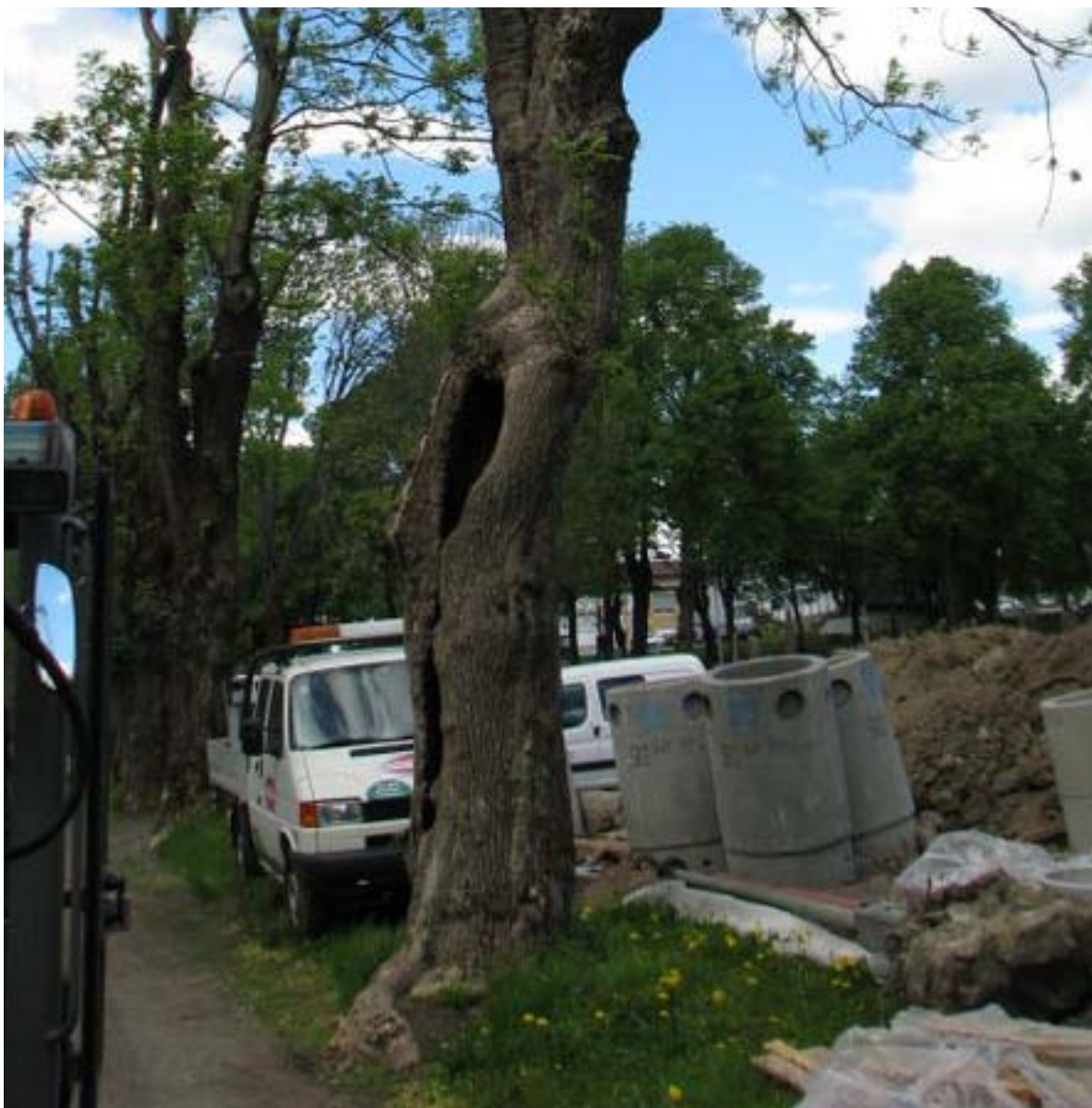
Figur 9. Tre nr 2-14 under arbeidet med å rehabilitere deler av Tønsberg gamle kirkegård. Etter arbeidet ble det behov for å heve muldnivået i treet siden dette tidligere var på bakkenivå (og nå da for lavt).

Det var derfor behov for å gjøre tiltak på spesielt ett tre (2-14, Figur 9 ). Rundt dette treet ble det fylt på ca. 20 cm jord rundt rota, noe som medførte at dagens hulhet havnet under bakkennivå. Ved mye nedbør kunne dette derfor danne en dam som høyst trolig ville være ugunstig både for larvene direkte, men og for substratets konsistens. Det ble hentet ut muld fra flere trær fra innlandet i Vestfold (tilsammen ca. 60-80 l). Mulda ble først lagt ute på et plastdekke for at den skulle tørke opp litt og dermed også sikre at færrest mulige andre invertebrater ble overført til det nye treet. I løpet av høsten ble det fylt på litt og litt muld i tre 2-14, til det var på samme nivå som tidligere, det vil si bakkenivå eller litt høyere. Det ble observert larver i treet gjennom hele prosessen og også etter at all mulda var fylt på.