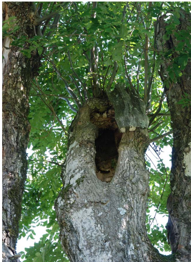
Figur 29. En hul ask ved Breidvei i Larvik kommune.

Hulheter kun funnet på ei platanlønn (a) og en ask (b), sistnevnte hadde en liten vanddam oppe i et kvisthull, som for øvrig er et sjeldent habitat, som kan huse den rødlistede billen Prionocyphon serricornis .