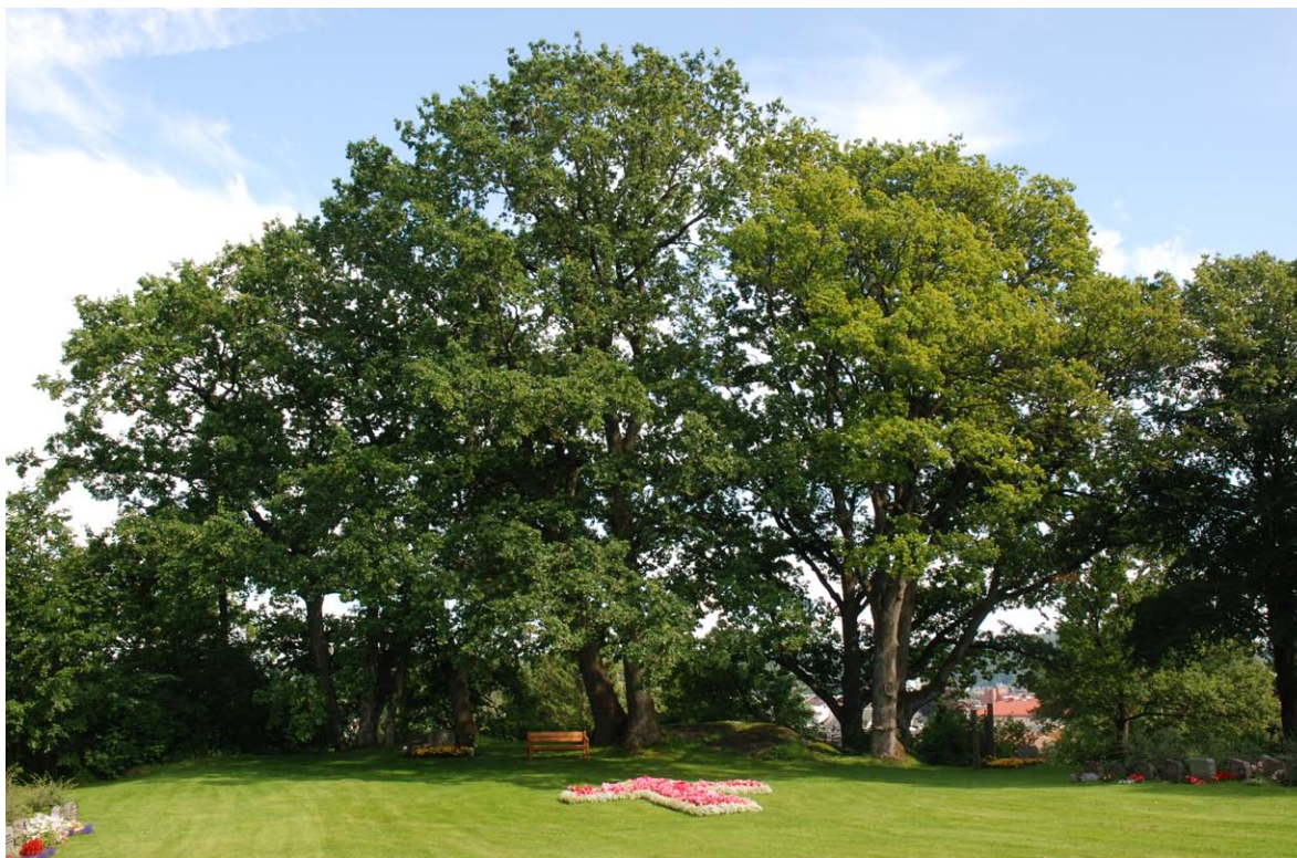
Figur 26. Parkområde med en rekke eldre eiker ved Ekeberg krematorium i Sandefjord kommune.

Godt stelt parkområde, ingen hule trær funnet. Mange eldre eiker, men ingen åpninger/kvisthull ble sett. Avsakde tørrgreiner besto konsekvent av hardved. Se forøvrig Jansson (2011).