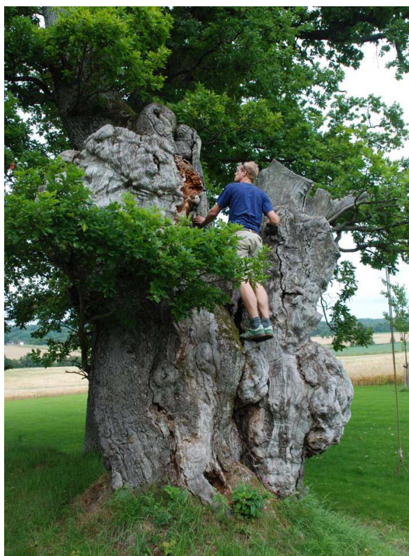
Figur 33. En av de meget grove eikene ved Østre Rom i Tønsberg kommune.

Gårdstun med en stor tuneik (a), som trolig er hul, men ikke har inspiserbare åpninger. Ytterligere et par store eiker står like nord for denne tuneika, ut mot Ringshaugvegen, men disse hadde ingen synlige åpninger og det er usikkert om de er hule. Flere store eiker gikk med i en låvebrann her for få år siden. Ca. 80 m nord for gårdstunet står en stor ask (b), som åpenbart er hul, men greinhullene er for små for inspeksjon.