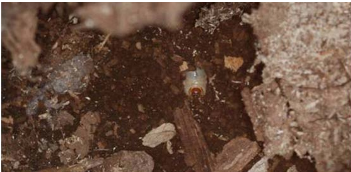
Figur 15. «Stor» eremittlarve som eter på treflis i bunnen av ask 2-14.

Under feltarbeid i 2011 er det vurdert hvilke områder, av de til nå kartlagte, som sannsynligvis best egner seg som potensielle lokaliteter for eremitt i forhold til utsetting/reintroduksjon (se 3.2.2 under). Under gis også en mer generell diskusjon om mulige problemstillinger, fremgangsmåte og strategi for et slikt tiltak.