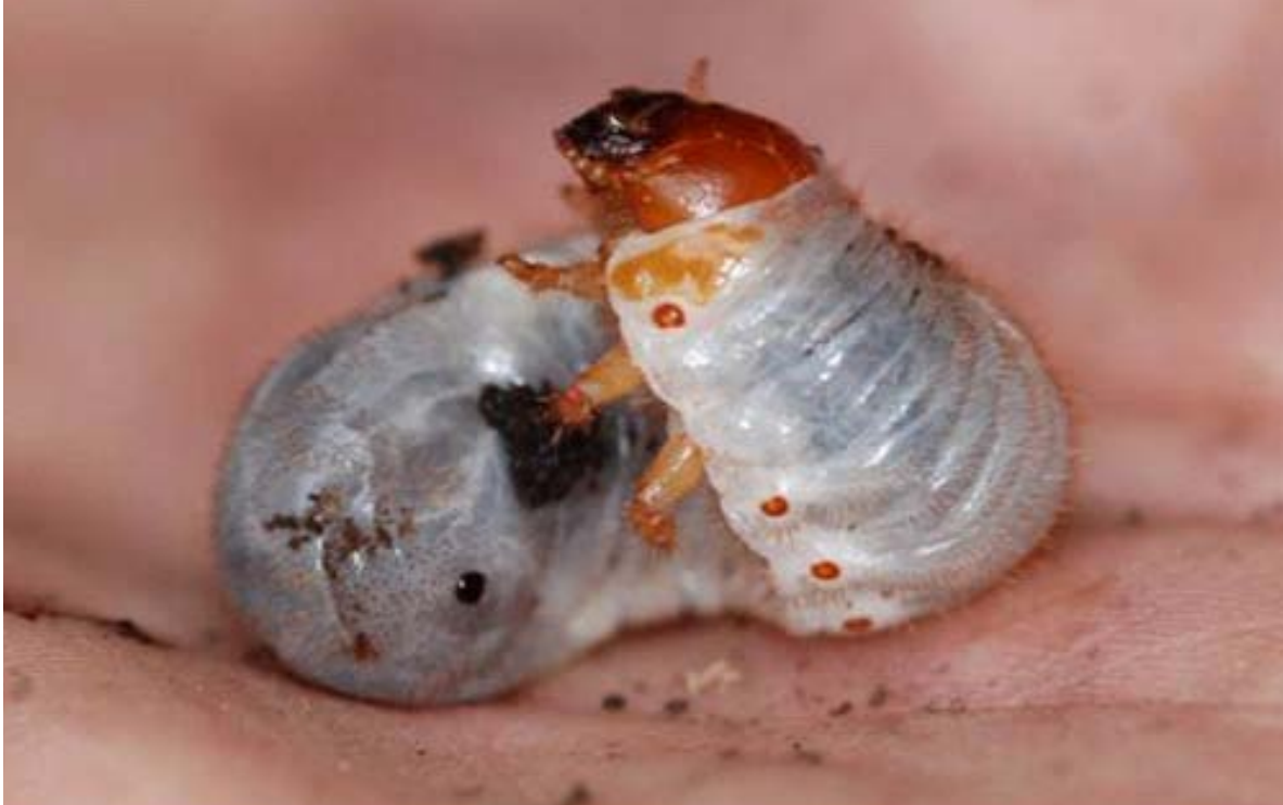
Figur 17. Eremittlarve fra ask nr. 10-2.

Voksne (Figur 18): Relativt få voksne individer er observert gjennom den perioden arten har vært kartlagt. Hunner man finner svermende, er også høyst sannsynlig også allerede befruktet (79 %; Svensson et al. 2011). Det er også slik at de fleste hunner vil legge størsteparten av eggene sine i det samme treet hvor hun selv ble utviklet, for så å forsøke og spre seg ved å legge de resterende eggene i et annet tre (Dubois et al. 2010). Dersom man kunne forvise seg om at hunnen alt hadde lagt egg i oppveksttreet, vil uttak av slike hunner bety mindre, og kanskje være ideelt i forhold til utplassering på ny lokalitet eller som utgangspunkt for en avlspopulasjon. Likevel kan man risikere at voksne individer vil forlate den nye lokaliteten før de legger egg (Knisley et al. 2005). Som utgangspunkt for en avlspopulasjon vil befruktete hunner være aktuelt, dersom man kan få dem til å legge egg i fangenskap. I Sverige er arten avlet i fangenskap, og etter 1-2 mnd. var resultatet 12-18 larver fra hver hunn (Jönsson 2003). Svensson et al. (2011) fant for øvrig at hunnen i snitt la 10,8 egg. Schalfrath (2003a) fant også at hunner i snitt la rundt ti egg. Eremithunnen som ble funnet død etter å ha blitt tråkket på ved Tønsberg gamle kirkegård inneholdt ni egg (sendt til DNA analyse).