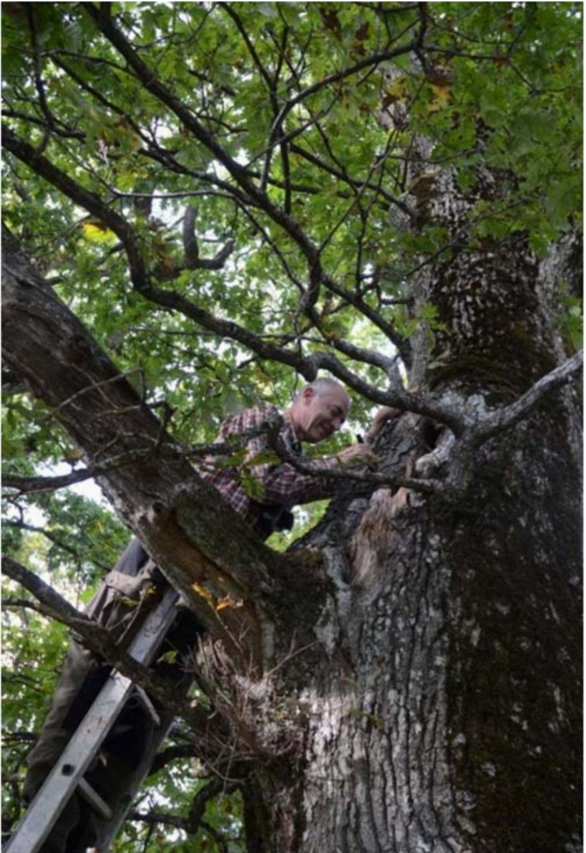
Figur 22. En av eikene fra Berg Fengsel (også avbildet i figur 19-21).