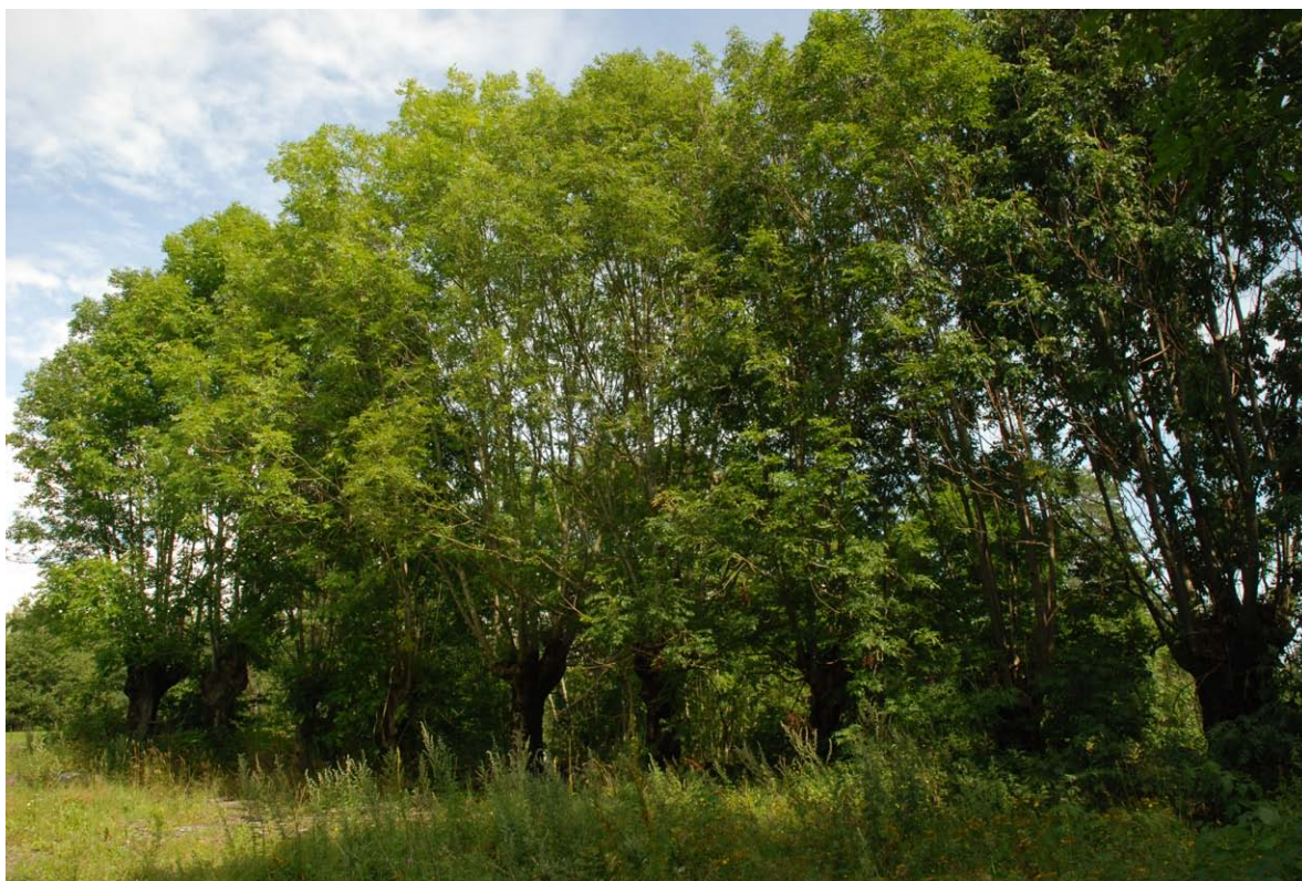
Figur 23. En askebestand ved Midtre Rørås i Tønsberg kommune. Bestanden er delvis gjen-grodd, og krever en del skjøtsel før den eventuelt kan bli aktuell som ny lokalitet for eremitt.

Antall asketrær med muld er trolig høyt nok til at det vil kunne la seg gjøre å etablere en eremitt-bestand her ( Figur 23 ). Mange av trærne har ennå bare så vidt åpninger og synlige hulrom, men antas å ha muld inne i stammen, eller vil få det i tiden framover. Det må en del rydding og fristilling til, da skog og kratt omkring skygger en del for stammene. Siden ask vokser raskere enn eik, kan det hende at yngre asker i samme område også vil kunne fungere som rekrutteringstrær i framtiden. Områdene rundt er ikke undersøkt, så potensialet for framtidige koloniseringsområder utover denne konkrete askebestanden er ukjent.