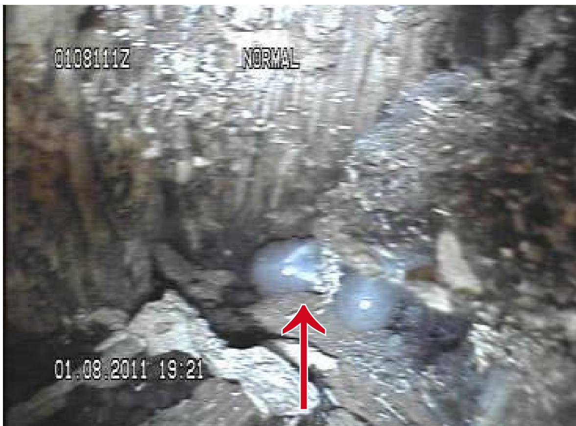
Figur 12. Larve av eremitt i et hult tre på Tønsberg gamle kirkegård i 2011.