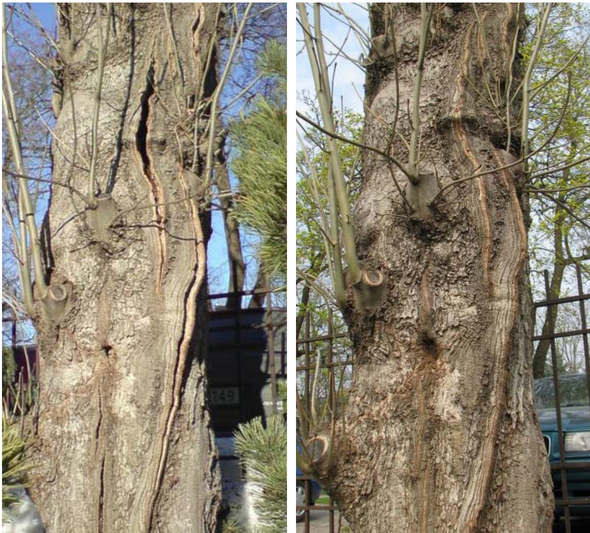
Figur 4 og 5. Typiske vintersprekker på tre nr 08-07. Figur 4 (til venstre) viser vinterbildet av stammen, mens figur 5 (høyre) viser samme stammen på sommerstid.

Sprekkene oppstår i sterk frost av to årsaker: 1) dels er trærnes vanninnhold mye lavere på vinteren enn om sommeren, og på grunn av tele og fordampning tørker veden ut uten mulighet for vannopptak. Så snart det frie vannet mellom cellene er borte, begynner treet å krympe. Ask krymper moderat, men mer enn gran og furu. Krympingen er størst tangentielt, det vil si slik at langsgående sprekker åpner seg. Mindre radielt, det vil si slik at diameteren blir mindre. I tillegg kan 2) hule trær være fulle av fuktig muld. Når denne fryser, blir det et press innenfra som også kan få sprekker til å åpne seg som spilene i en kinesisk lampe. Når frost og tele er over og treet kan begynne å ta opp vann fra bakken, lukker sprekkene seg tett igjen.