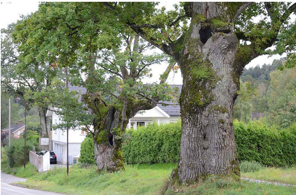
Figur 25. Grove, hule eiker langs riksveien ved Eidanger Prestegård i Skien kommune.

Langs riksvegen mot Skien står det i dag igjen fem grove og hule eiker, med diameter ved brysthøyde på hhv. 530 (a), 570 (b), 630 (c), 840 (d) og 670 cm (e). Flere av dem har store hulrom og til dels åpninger som voksne mennesker kan bevege seg inn i (d), men noen av åpningene var stengt med hønsenetting (a, b). Noen av trærne har ennå store mengder rød muld, og muld fra alle tilgjengelig hulrom i nedre del av trærne ble undersøkt, uten at ekskrementer fra våre største skarabider ble funnet. På to av trærne (c og d) vokste det oksetungesopp ( Fistulina hepatica ).