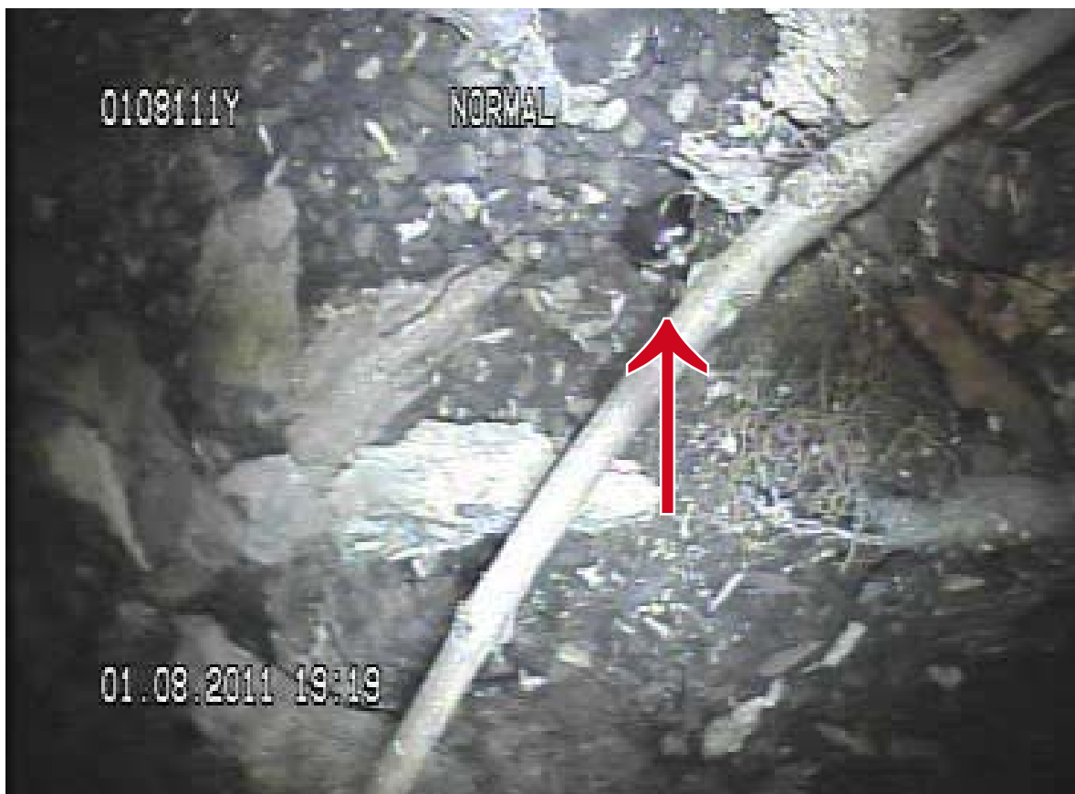
Figur 11. Et voksent individ (det eneste) observert i et hult tre på Tønsberg gamle kirkegård i 2011.