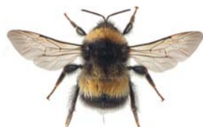
Taigahumle ●* Bombus sporadicus