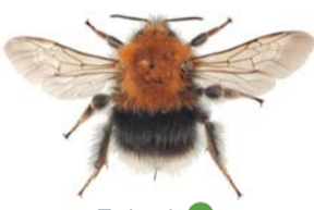
Trehumle ● Bombus hypnorum