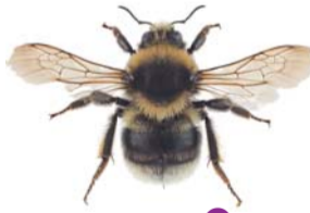
Sibirhumle ●○ Bombus semenoviellus