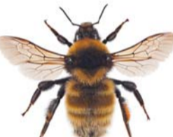
Kløverhumle ●○ Bombus distinguendus