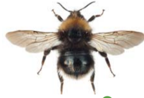
Markgjøkhumle ● Bombus sylvestris