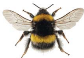
Lys jordhumle ● Bombus lucorum