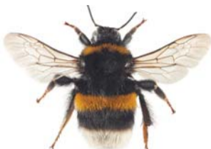
Mørk jordhumle ● Bombus terrestris