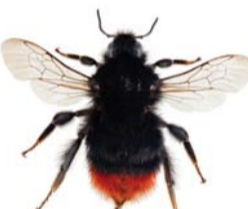
Steinhumle ● Bombus lapidarius