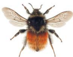
Lapphumle ●▲ Bombus lapponicus