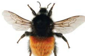
Alpehumle ●▲ Bombus alpinus