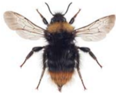
Markhumle ● Bombus pratorum