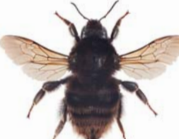
Slåttehumle ●○ Bombus subterraneus