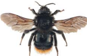
Steingjøkhumle ● Bombus rupestris