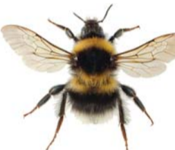
Hagehumle ● Bombus hortorum