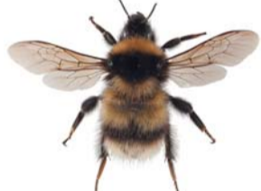
Fjellhumle ●▲ Bombus balteatus