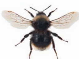
Lundgjøkhumle ●○ Bombus quadricolor