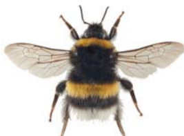
Kilejordhumle ● Bombus cryptarum