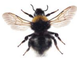
Tregjøkhumle ● Bombus norvegicus