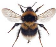
Lynghumle ● Bombus jonellus