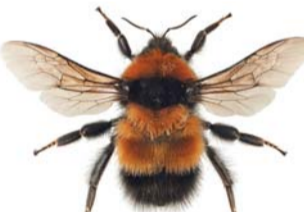
Tundrahumle ●▲ Bombus hyperboreus