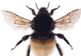
Polarhumle ●▲ Bombus pyrrhopygus