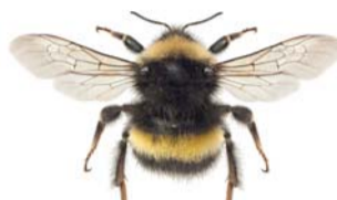
Kragejordhumle ●~ Bombus magnus