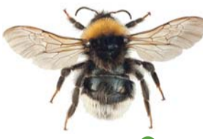
Jordgjøkhumle ● Bombus bohemicus