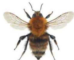
Bakkehumle ●○ Bombus humilis