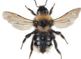
Åkergjøkhumle ● Bombus campestris