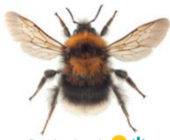
Barskoghumble ●* Bombus cingulatus