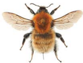
Kysthumle ●~ Bombus muscorum