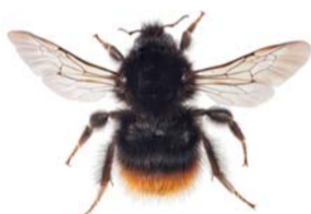
Tyvhumle ●* Bombus wurflenii