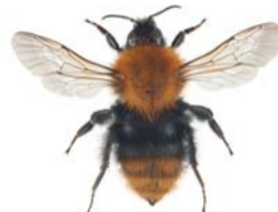
Åkerhumle ● Bombus pascuorum