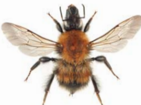
Lushatthumle ●* Bombus consobrinus