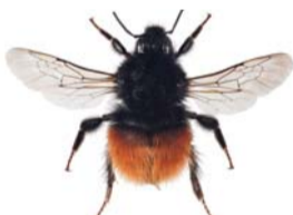
Berghumle ●▲ Bombus monticola