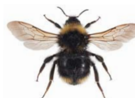
Lynggjøkhumle ●▲ Bombus flavidus