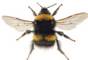
Lundhumle ● Bombus soroeensis