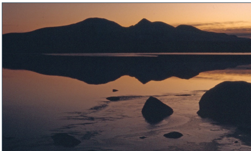
Kveld over Femunden.