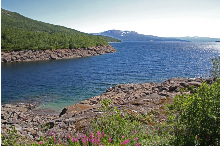
Røssvatnet i sommervær.