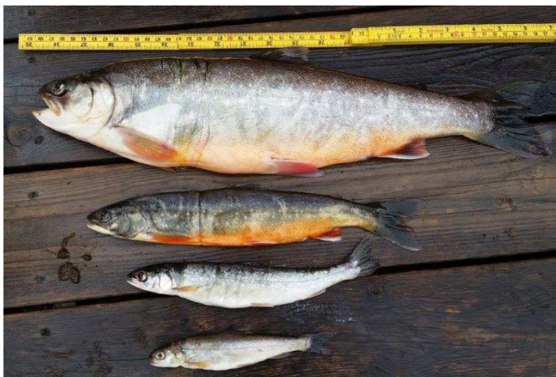
Røye fra Røssvatnet, 2016.

Ved hjelp av ekkolodd er total fiskemengde i de åpne vannmassene beregnet til 12,8 tonn, som tilsvarer ca. 0,6 kg per hektar.