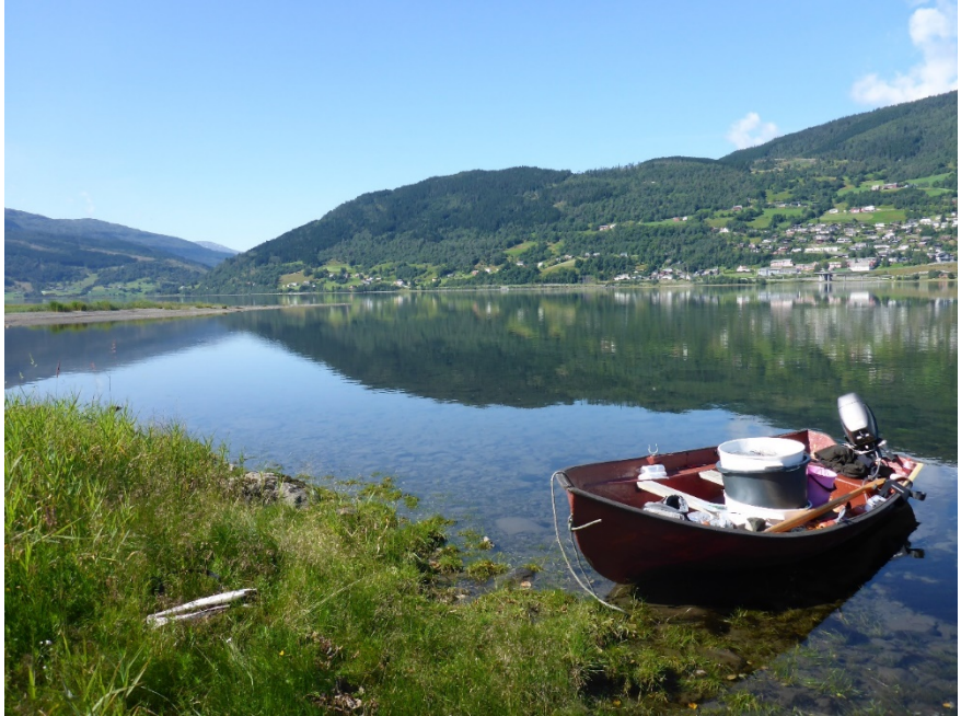
Vangsvatnet i solskinn.