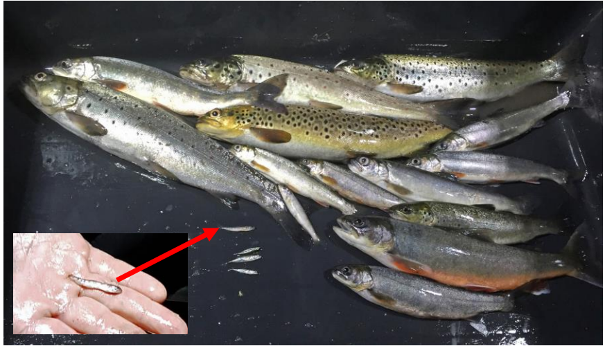
Trålfangst fra Snåsavatnet. Merk årsyngel av røye.