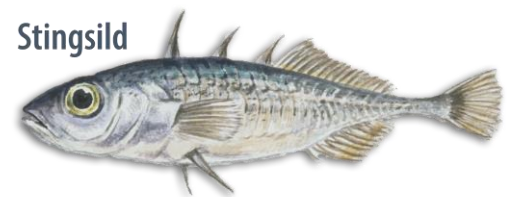
Illustrasjoner: E. Olderøien

Mengden dyreplankton i Snåsavatnet var noe høyere enn i de andre innsjøene i Trøndelag. Andelen store vannlopper, som er den planktongruppa som er mest utsatt for fiskepredasjon, var likevel lav. Dette kan skyldes beiting fra fisk, men det kan også ha sammenheng med humusinnhold og planteplankton.