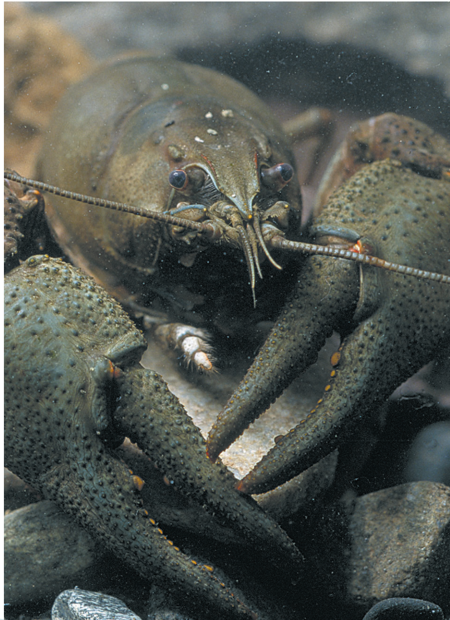
Edelkrepsen er en viktig ressurs i Lyseren.

Det er definert 23 tiltak som skal gjennomføres i løpet av 2010 som støtter oppunder målsettingene i driftsplanen. Foreningen utarbeider årlige tiltaksplaner hvor det blir det blir fastsatt hvilke tiltak som skal gjennomføres, hvem som har ansvaret for dem og hvordan de skal gjennomføres. Foreslåtte tiltak legges fram for Lyseren Samarbeidsutvalg for å få innspill til tiltakene. Tiltaksplanen behandles og vedtas av årsmøtet for Lyseren Grunneierforening som gjennomføres i februar.