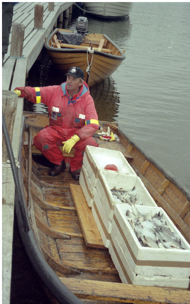
Driftsplanen for Femund-Trysilvassdraget omhandler både yrkesfiske og fritidsfiske, og gir anvisninger slik at de to bruksmåtene kan kombineres.

Plandokumentet på nesten 100 sider består av en innledende statusdel som fiskeribiologiske forhold, informasjon og tilrettelegging og næringsaktiviteter i hele planområdet. Handlingsdelen består først av tre overgripende tiltak relevant for hele området, deretter følger en områdevis tiltaksplan med prioritering av tiltak og finansieringsplan for disse. Siden planen dekker et så omfattende område, omfatter den i noen tilfeller mindre, lokalt avgrensede driftsplaner.