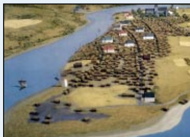
Trondheim i høymiddelalderen. (Modell ved Erik Jondell og Marquette modellverksted)

Bebyggelsen: Vanlige folk bygger hus av laftet tøm-