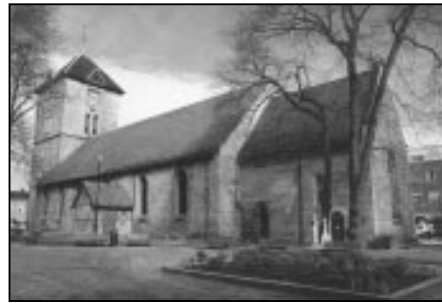
Vår Frue kirke.

Religionen var tett sammenvevd med dagliglivet i middelaldersamfunnet. I middelalderens Trondheim lå kirkene og klostrene tett i forhold til bebyggelsen. Det var 17 kirker, hvorav åtte sognekirker. Det har vært fem klostre og ett hospital, alle med kirke (som kan inngå i de 17). I tillegg lå erkesetet med Erkebisppegården her. Det var mange kirker i forhold til de ca. 3000 innbyggerne da byen var på sitt største i middelalderen, men også selve byrommet ble brukt i gudsdyrkelsen. Både sognebarn og pilegrimer gikk i prosesjon i gatene på kirkens festdager, ved tingsetting m.m. I dag er få av kirkene synlige i bybildet. Noen ble nok bare bygget i tre. Andre kan ha forsvunnet i en av de mange bybrannene. Stein-kirkene ble raskt brutt ned når de gikk ut