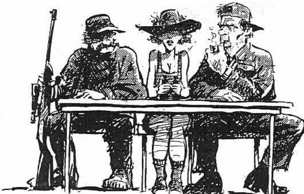
Figur 3: Lokal utmarksforvaltning domineres gjerne av menn. Tegning: Oscar Jansen. Kilde: Storaas et al. 1996, s 63.

Mannsdominans i utmarksforvaltningen kan i et likestillingsperspektiv betraktes som urettferdig, og som en konsekvens av dette kan beslutninger som tas anses som illegitime. En annen konsekvens er at kvinners ressurser ikke utnyttes innen utmarksnæringene. Kvinner kan bringe inn nye ideer til hvordan en kan utnytte utmarka, men slik ideer går en glipp av som en følge av kvinneunderskudd i relevante råd og utvalg. Sist, men ikke minst, vil kvinner ikke kunne fremme sine interesser innen dette feltet i det offentlige rom. Som vår informant er inne på, har menn sterke interesser i utmarka. Disse interessene kan ikke betraktes som uttrykk for allmenninteresser så lenge halvparten av befolkningen ikke deltar i forvaltningen. Menns interesser kan stå i motstrid til kvinners interesser. Demokratisk underskudd er, sammen med undernyttelse av ressurser, konsekvenser av mannsdominans i utmarksforvaltningen.