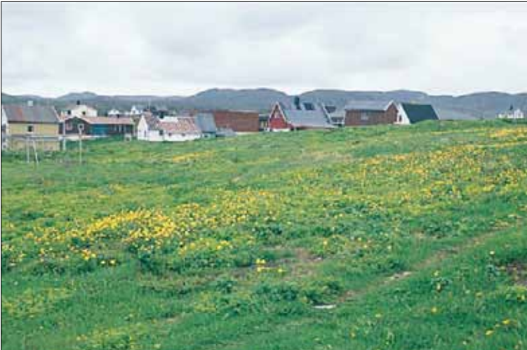
G13 Frisk, næringsrik «natureng», her med marikåpe-arter Alchemilla spp., skogstorkenebb Geranium sylvaticum og ballblom Trollius europaeus . Finnmark, Gamvik, Gamvik, 1992. Hemiarktisk (Moen 1998), O1.