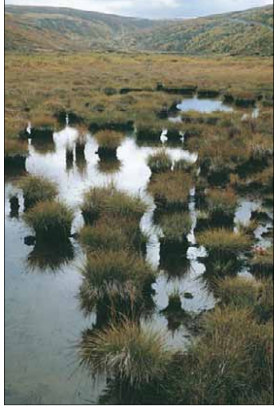
O3d Elvesnelle-starr-sump, stolpestarr-utforming: lite bestand av stolpestarr Carex nigra ssp. juncella , sent i sesongen. Oppland, Dovre, Grimsdalen, 1984. NB, OC.

O3d Stolpestarr-utforming Bestand dominert av stortuet stolpestarr Carex nigra ssp. juncella , i grunne sumper med store vekslinger i vannstand. Oligotroft-mesotroft. Østlig. SB-NB, O1-C1.