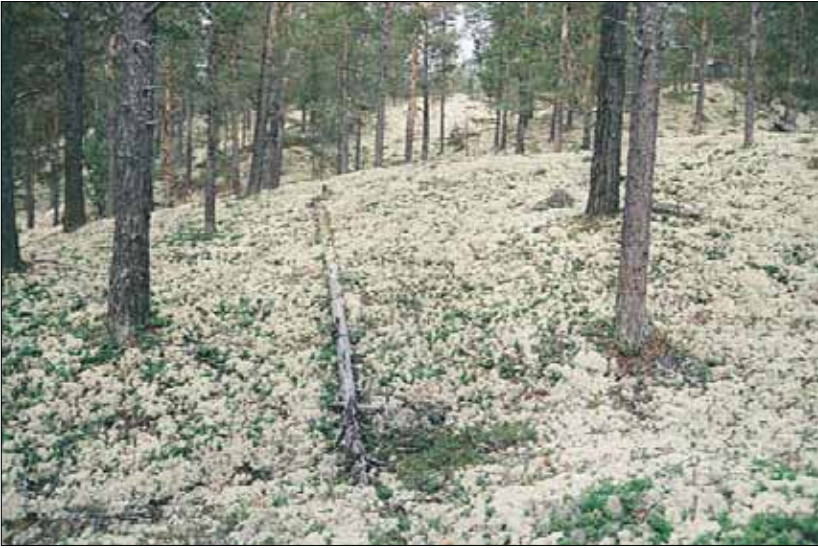
A1a Lavskog, lav-furu-utfoming: i sin reneste utfoming med hvitkrull Cladonia stellaris og tyttebær Vaccinium vitis-idaea . Hedmark, Follidal, NV Straumbu, 1995. MB, CI.