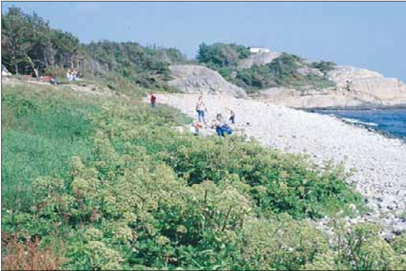
V5a Driftinfluert grus/steinstrand, strandkvann-utforming: sammenhengende belte med strandkvann Angelica archangelica ssp. litoralis . Aust-Agder, Arendal, Tromøya, 1995. BN, O2.

V5c Østersurt-utforming. Åpne bestand av østersurt Mertensia maritima på sand eller grus på eksponerte strender,