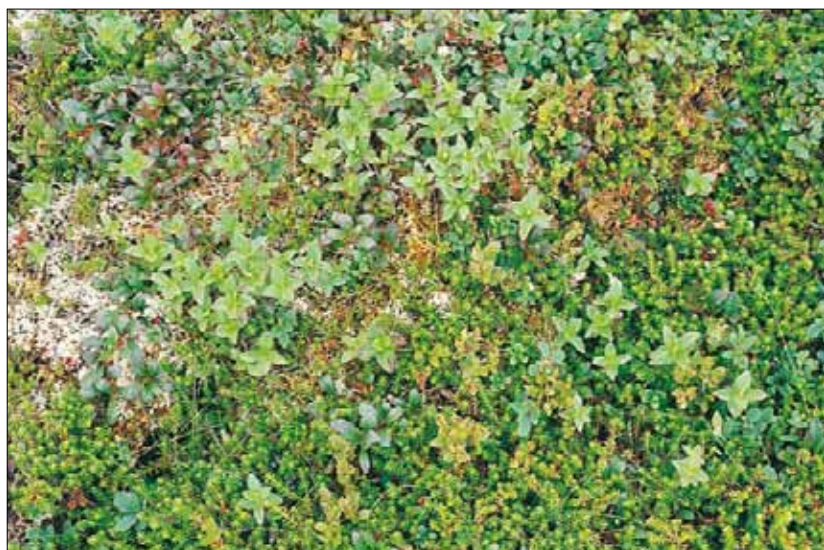
S3b Blåbær-blålynghei og kreklinghei, humid utforming; utsnitt av kreklinghei med Empetrum nigrum coll., bærlyngarter Vaccinium spp., rypebær Arctostaphylos alpinus og skrubbær Cornus suecica . Mosedominert bunnsjikt, med innslag av reinlav Cladonia spp. Møre og Romsdal, Aure, Litlefonna, 1993. LA, O3.

Referanser - S3a: Nordhagen (1943), Dahl (1956), Hagen (1976), Taagvold (1978), Sanderud (1982), S3b: Knaben (1950), Malme (1971), Baadsvik (1974c), Kristiansen (1975a), Taagvold (1978), Fremstad & Moe (1982), Johansen (1983), Økland & Bendiksen (1985, tab. 2a).