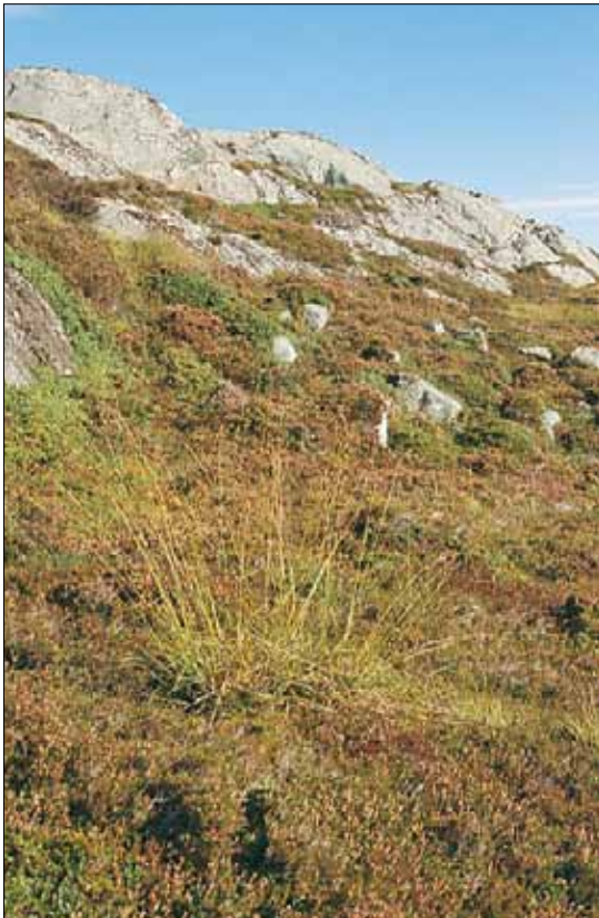
H1a Tørr lynghei, røsslyng-utforming: sørvendt skråning med røsslyng Calluna vulgaris og mjølbær Arctostaphylos uva-ursi , og heistarr Carex binervis i forgrunnen. Sør-Trøndelag, Hitra, Gjøsoya, 1988. SB, O3.

Referanser - Nordhagen (1917), Skogen (1965, 1971), Kristiansen (1975a), Øvstedal (1985), Fremstad et al. (1991), Skogen & Odland (1991).