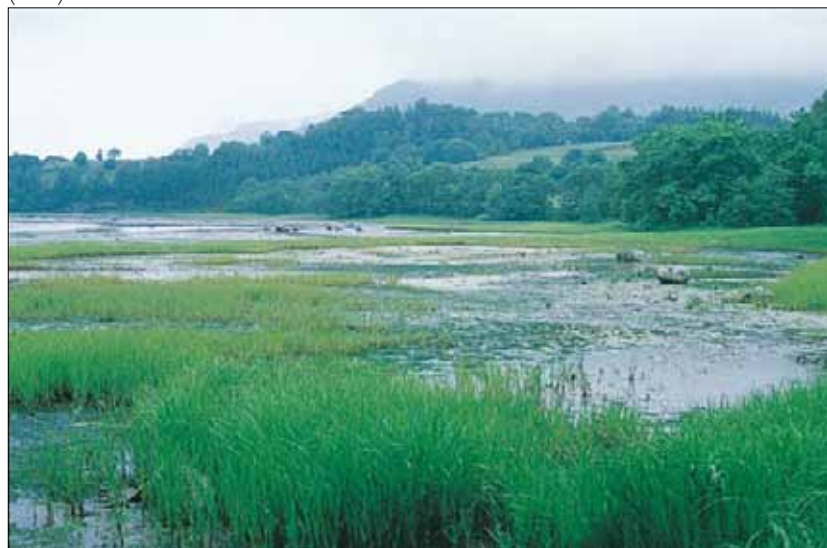
U8c Brakkevannssump, havstarr-utforming: grunn fjordvik med havstarr Carex paleacea , omgitt av svartor Alnus glutinosa . Sogn og Fjordane, Askvoll, Straumen, 1978. BN, O3.

Referanser - Dahl & Hadac (1941), Skogen (1965), Fjelland et al. (1983), Veve (1985b), Holten et al. (1986a), Elven et al. (1988a, 1993b), Kristiansen (1988a), Sasse (1988a), Lundberg (1989).