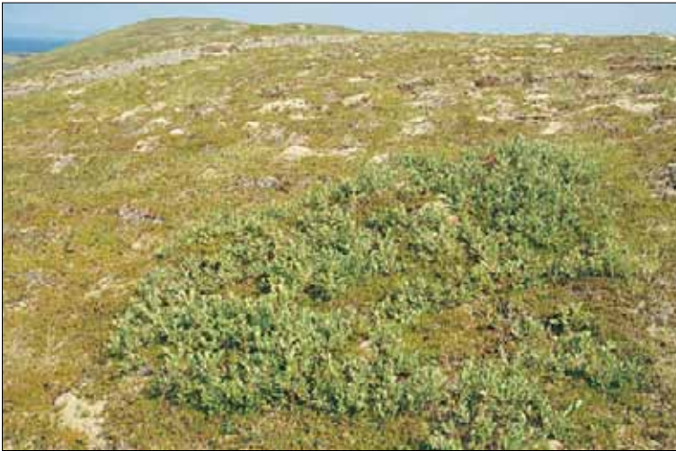
H1e Tørr lynghei, røsslyng-heigråmose-lav-utforming: med røsslyng Calluna vulgaris , krekling Empetrum nigrum coll. og heigråmose Racomitrium lanuginosum , og ørevier Salix aurita , her et tegn på begynnende gjengroing. Sør-Trøndelag, Bjugn, Asenøy, 1988. SB, O3.

m bråtestarr Carex pilulifera vanlig arve Cerastium fontanum ssp. vulgare skrubbeær Cornus suecica flekkmariehånd Dactylorhiza maculata knegras Danthonia decumbens smyle Deschampsia flexuosa krekling Empetrum nigrum coll. lyngøyentrøst Euphrasia micrantha rødsvingel Festuca rubra ssp. rubra geitsvingel Festuca vivipara hårsveve Hieracium pilosella kystgriseøre Hypochoeris maculata tiriltunge Lotus corniculatus markfrytle Luzula campestris engfrytle Luzula multiflora ssp. multiflora hårfrytle Luzula pilosa stormarimjelle Melampyrum pratense