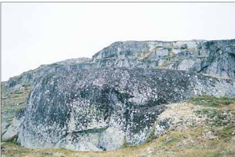
R7 Epilittisk lav-vegetasjon: kan enkelte steder dekke betydelige arealer, enten på bergvegger eller i blokkmark. Hordaland, Ulvik, Finse, 1995. LA, OI.

R7c Bladlav-dvergbusklav-utforming. Med Parmelia - Arctoparmelia -samfunnene, steinskjegg- Pseudophebe -samfunnet og rabbelav- Brodoa -samfunnet. På steiner og berg med noe finmateriale, basefattig.