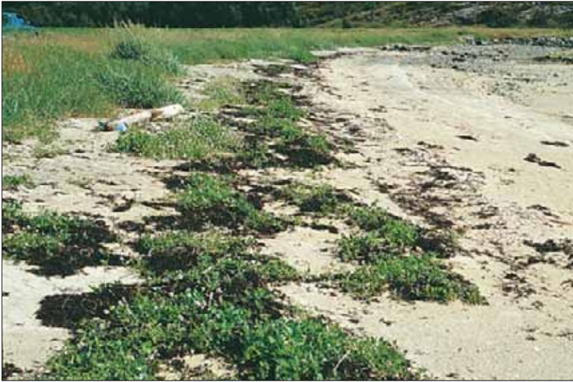
V1c Ettårig melde-tangvoll, tangmelde-utforming: skjermet tangvoll med tangmelde Atriplex prostrata ssp. prostrata og vanlig strandreddik Cakile maritima ssp. maritima . Nord-Trøndelag, Nærøy, Abelvær, 1988. SB, O3.