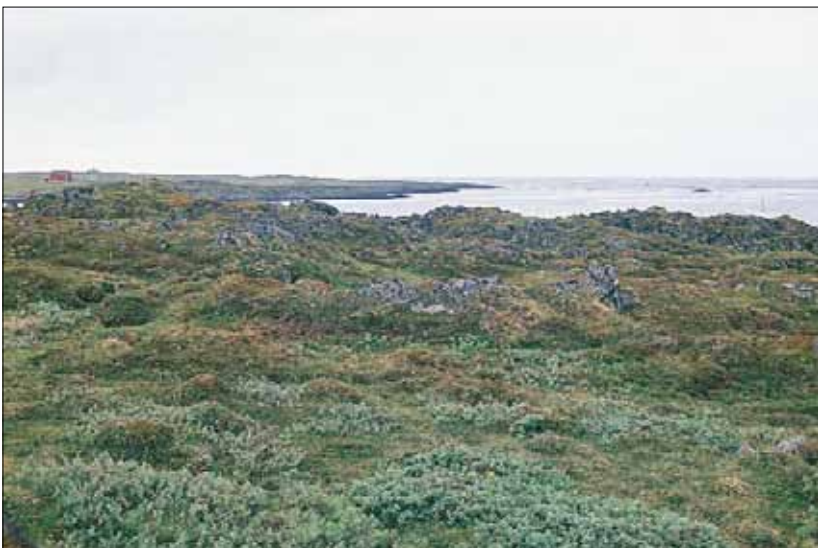
R4a Reinrose-kantlyng-mose-rabb, reinrose-utforming: rik hei med reinrose Dryas octopetala , i tynt dekke over berg; i senkningen rikt vierkratt, nærmest beslektet med S7, men uten høystauder. Finnmark, Gamvik, Gamvik, 1992. Hemiarktisk (Moen 1998), O1.