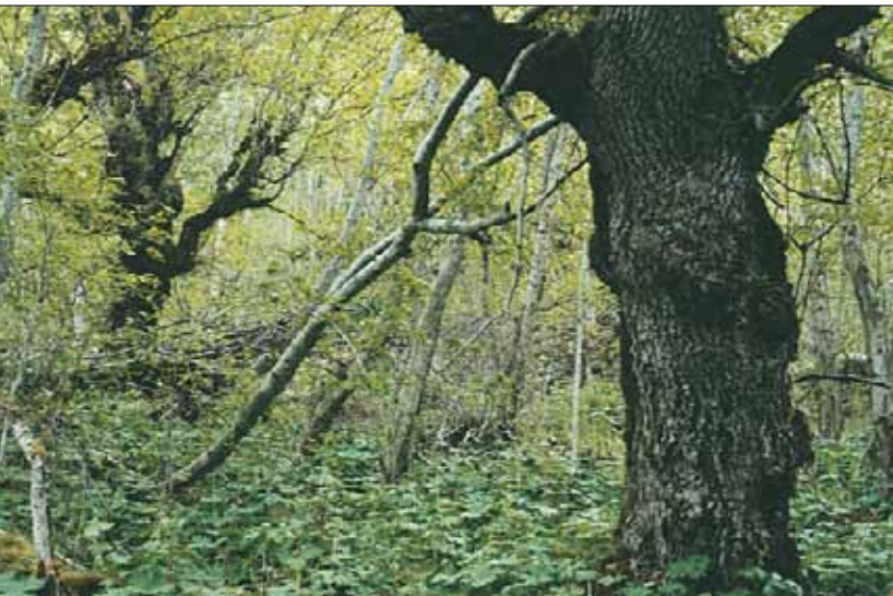
D5 Gråor-almeskog: her med godt utviklet feltsjikt dominert av tyrihjel Aconitum septentrionale . Småvokst gråor Alnus incana ssp. incana , tidligere lauvet alm Ulmus glabra . Sogn og Fjordane, Luster, Loi, 1983. SB, OC.