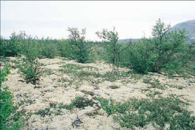
A1b Lavskog, lav-fjellbjørk-utfoming: åpen, med ca 4 m høy fjellbjørk Betula pubescens ssp. czerepanovii og mye dvergbjørk Betula nana i bunnen. Oppland, Ringebu, Ringebufjellet, 1995. NB, OC.