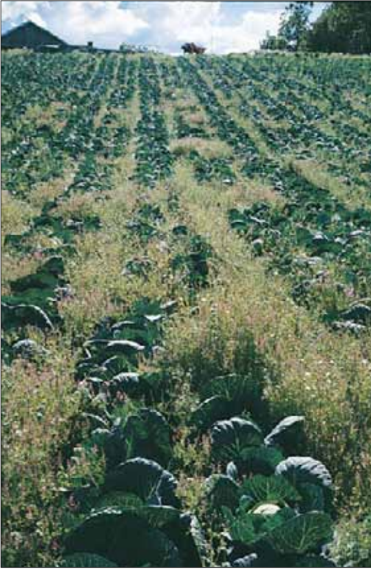
I4a Ugrasvegetasjon på dyrket mark, utforming mest av ettårige arter. Kålåker med jordrøyk Fumaria officinalis og åkersvineblom Senecio vulgaris . Nord-Trøndelag, Frosta, Tautra, 1988. SB, O1.