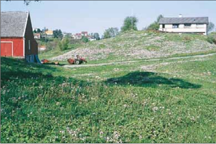
G12b Våt/fuktig, middels næringsrik eng, engkarse-krypsoleie-utforming: med engkarse Cardamine pratensis ssp. pratensis og krypsoleie Ranunculus repens . Hordaland, Bergen, Apeltun, 1994. BN, O3.