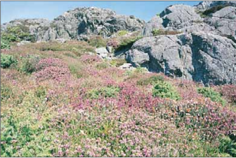
H1b Tørr lynghei, purpurlyng-utforming: med røsslyng Calluna vulgaris , purpurlyng Erica cinerea og klokkelyg Erica tetralix i blomst. Rogaland, Karmøy, Peradalen, 1995. BN, O3.