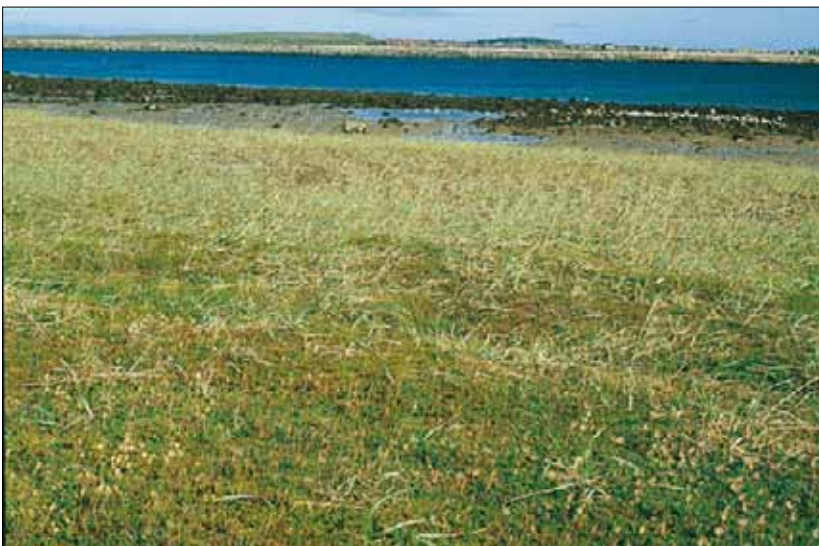
W2c Dyneeng og dynehei, reinrose-utforming: stabilisert flyesand med sluttet feltsjikt der strandrug Leymus arenarius , krekling Empetrum nigrum coll. og reinrose Dryas octopetala dominerer. Finnmark, Vardø, Svartnes, 1983. NB, OC.