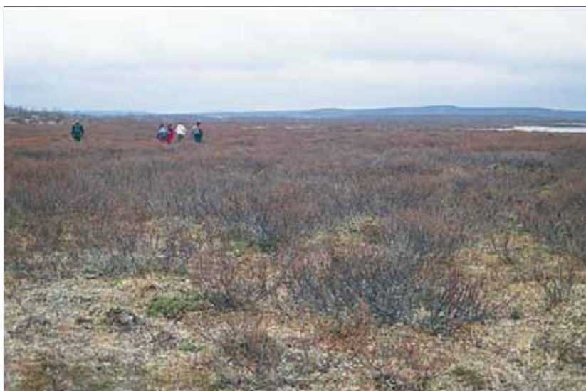
S2a Einer-dvergbjørkhei, fattig utforming: her helt dominert av dvergbjørk Betula nana , etter bladfelling, og med lavdominert bunnsjikt. Troms, Nordreisa, Raisjavre, 1992. NB, CI.