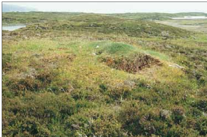
X2b Fuglegjødslite kystvegetasjon, grasurt-utforming: her fuglegjødslite tue i kystlynghei, med mye smyle Deschampsia flexuosa og gulaks Anthoxanthum odoratum ssp. odoratum. Sør-Trøndelag, Bjugn, Været i Tarva, 1988.