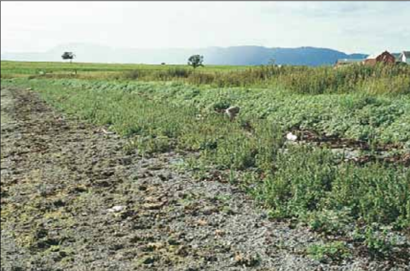
V1c Ettårig melde-tangvoll, smånesle-utforming: bord av smånesle Urtica urens , foran V2 flerårig gras/urte-tangvoll, lavurt-utforming med gåsemure Potentilla anserina ssp. anserina . Beskyttet område med næringstilsig fra dyrket mark. Nord-Trøndelag, Frosta, Tautra, 1988. BN, O1.