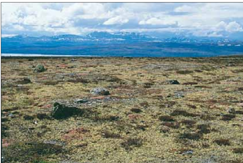
R1b Greplyng-lav/moserabb, lav-utforming: tidlig i sesongen med greplyng Loiseleuria procumbens i blomst. Dekker store arealer p  flyene p   stsiden av Femunden. Hedmark, Engerdal, Falkfangerh gda, 1985.