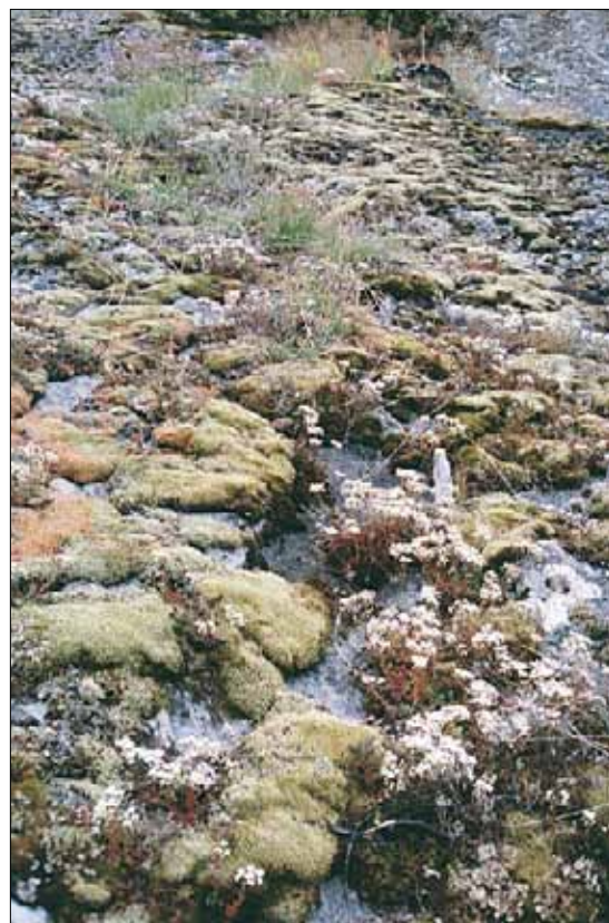
F3b Bergknapp og bergflate, bakkemynte-hvitbergknapp-utforming: moserikt berg med hvitbergknapp Sedum album . Oppland, Lom, Galdesand, 1985. MB, OC.

Referanser - Sunding (1965), Marker (1969), Halvorsen (1980), egne observ.