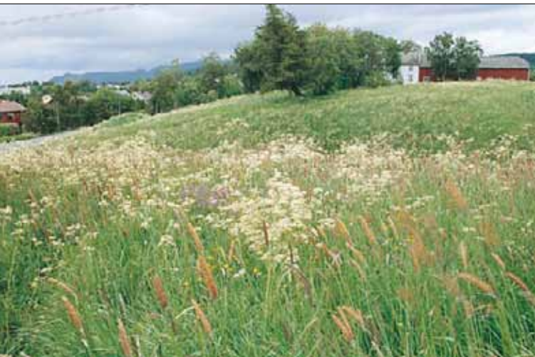
G14 Frisk, næringsrik «gammeleng»: her forsommeraspektet til et forfallstadium med hundekjeks Anthriscus sylvestris og engreverumpe Alopecurus pratensis . Sensommeraspektet har bl.a. mye mjødukt Filipendula ulmaria og sibirbjønnekjeks Heracleum sibiricum . Sør-Trøndelag, Trondheim, Moholtdalen, 1990. SB, O1.