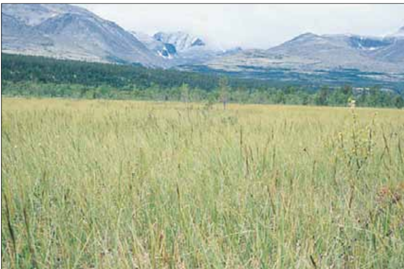
L4c Høystarrmyr, nordlandstarr-utforming: flatmyr med nordlandstarr Carex aquatilis . Hedmark, Stor-Elvdal, Atnsjømyrene, 1995. NB, C1.

Sosiologisk tilknytning - L4a: Caricion lasiocarpae. L4b-c: Magnocaricion p.p. Se også O3-4.