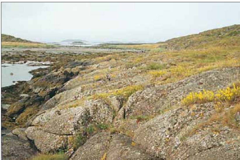
XIb Strandberg, rik utforming: gras- og urterik utforming med gulmaure Galium verum i blomst. Sør-Trøndelag, Bjugn, Asenøy, 1988. SB, O3.