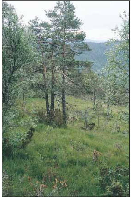
A7c Grasdøminert fattigskog, blåtopp-utforming: bestand av furu Pinus sylvestris og dunbjørk Betula pubescens ssp. pubescens , med blåtopp Molinia caerulea i bunnen. Hordaland, Kvam, under Vesoldo, 1981. MB, O3.

jord eller humuspodsol, pH 4,0-4,5, høyt glødetap. Blåtoppskoger varierer i artsammensetning, fra utforminger beslektet med fattig sumpskog (E1), til blåbærskog (A4) og lavurtskog (B1). Artsliste gis derfor ikke for utformingen. BN-NB, O3-O1.